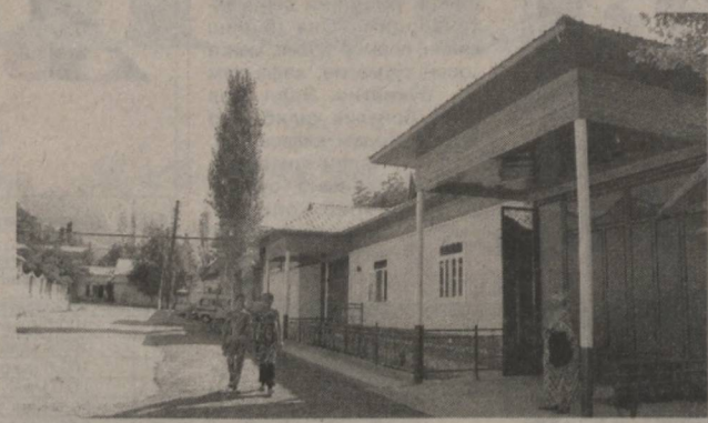
Йил 3 августдаги "Қишлоқ жойларидида уй-жой қурилиши кўламини кенгайтиришга оид қўшимча чоратadbирлар тўғрисида"ги қарори айнаи мудадо бўлди. Ўз вақтида ва

Орамизда иморат кўтаришга алоҳида этибор қаратадиган, унинг пишк-пукталигига, шакл-шамойилининг кўркам бўлишига ва унда зарур шароитларни яратишга ҳаракат қилаётганлар кўп. Албатта, бу ўз-ўзидан бўлмади. Бу ўринда Президентимизнинг 2009