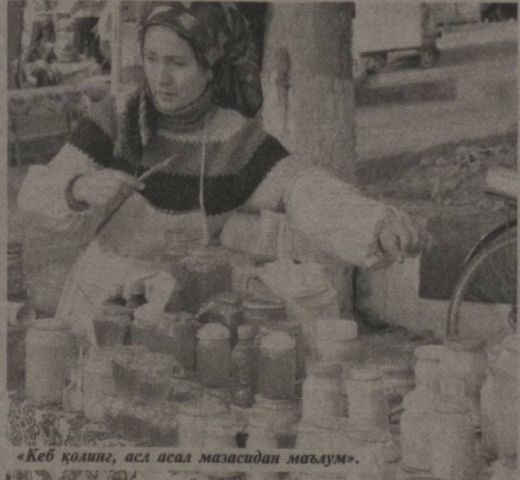
«Кеб қилиш, асал асал мазасидан маълум».