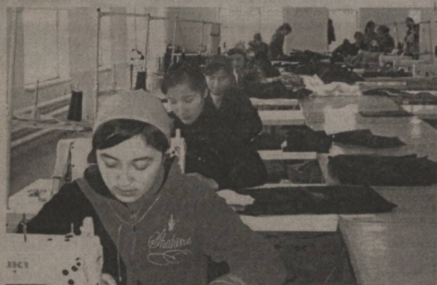
Муаллиф олган суратлар.

яна ярим гектар майдонда иссиқхона қурилиб, помидор кўчати экилади. "Агробанк"нинг Тошбулоқ бўлимидан иссиқхона қурилиши учун фермер ҳўжалиги 50 миллион сўм кредит олган. Банк сармояси фермерга мадақкор бўлди.