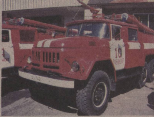
дондаги уй жиҳозлари ёниб кетди.

Ўшунинг билан бир қаторда, ёнги хавфсизлиги кафолатланмаган мосламалардан, ҳатто қўлбола ясалган ускуналардан фойдаланиш ҳоллари кузатилади. Ўшунинг билан бир қаторда, ёнги хавфсизлиги кафолатланмаган мосламалардан, ҳатто қўлбола ясалган ускуналардан фойдаланиш ҳоллари кузатилади.