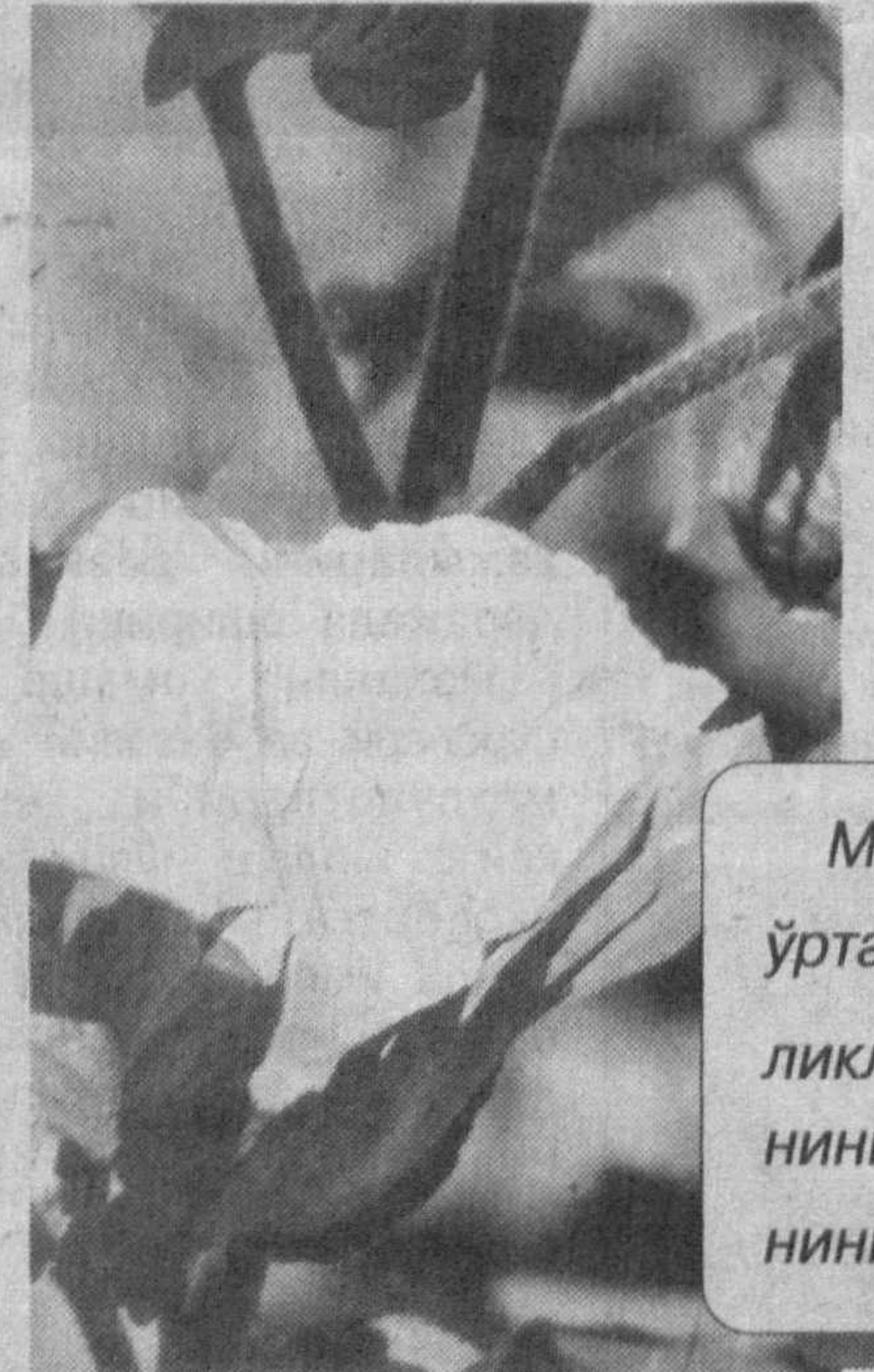
(Давоми. Боши 1-бетда).

Тўғри, бу йил кўкларнинг серёғини келиши экин-тикин ишларида бир оз қийинчиликлар туғдирди. Аммо табиатнинг бундай синовларида тобланиб олиш зарур. Бундан қийинчиликлар чигитнинг оби-тобида ўндириб олдилар. Бундан ҳўкуматимиз томонидан уларга мўносиб иш шaroити яратилиб, «иссиқ-сувоғи» дан бохабар бўлиб турилган муҳим омил бўлди.