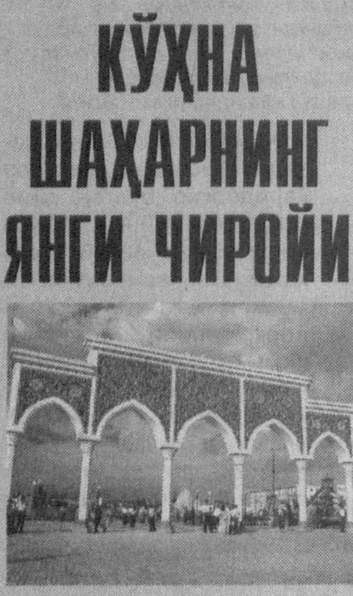
(Давоми. Боши 1-бетда).

«Sarkor Telecom»дан янги сайт Интернет хизматини кўрсатувчи «Sarkor Telecom» компанияси мижозлари учун янги кино сайт — kinoman.uz очилди. Эслатиб ўтиш жоизки, ушбу компания кенг миқёсда он-лайн лойиҳалар ишлаб чиқиб, шунингдек, мижозларга қўлайликлар яратиш бўйича интернет хизматини ташкил этувчи тармоқлар орасида катта мавқега эга. Ана шундай ишларнинг узвий давоми сифатида эълон қилинган янги сайт миллий ва жаҳон киноси янгиликлари ва кинорейтингини бериш бориш ҳамда форумлар ташкил этишга мўлжалланган. Мўҳим тарафиди, мижозлар сайтдаги фильмларни ўз компьютерларига кўчириб олишлари мумкин. «Sarkor Telecom» тармоқдаги интернет хизматлари мижозлари ушбу сайтдан бегул фойдаланиш имконига эгадирлар. Қобил ХИДИРОВ.