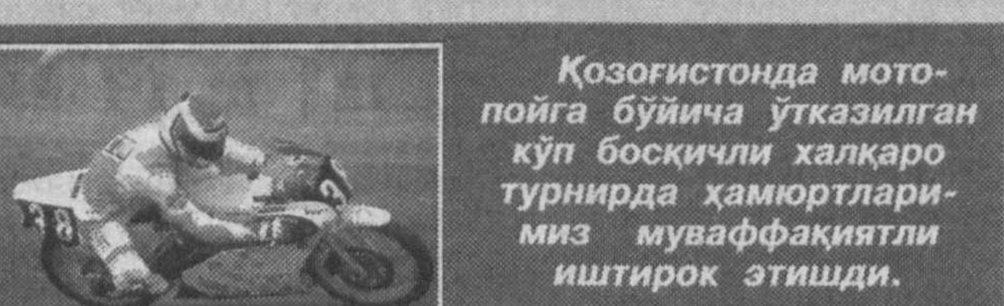
Қозоғистонда мотопойга бўйича ўтказилган кўп босқичли халқаро турнирда ҳамюртларимиз муваффақиятли иштирок этишди.

Рўйхатнинг биринчи поғонасида ҳамюртимиз, ушбу йўналишнинг ўта оғир вазн тоифасида жаҳон чемпиони Руслан Чагаев бормоқда. Иккинчи ўринни россиялик собик жаҳон чемпиони Николай Валуев эгаллаб турибди. Шунингдек, беларуслик Сергей Ляхович ва америкалик Жон Руиз ҳам рўйхатнинг юқори поғоналаридан жой олишган. Халқаро бокс ташкилоти (WBO)да ҳам июль ойи рейтингини эълон қилинди. Ўзбекистонлик боксчилар Қаҳрамон Орзуқулов (52,1 кг.) ва Қувончбек Тойғонбоев (69,8 кг.) чемпи-онлик учун жанг ўтказиш ҳуқуқини берувчи ўринларга тобора қўриланиб боришмоқда. Рейтингда Қаҳрамон бешинчи, Қувончбек эса олтинчи ўринда қайд этилган.