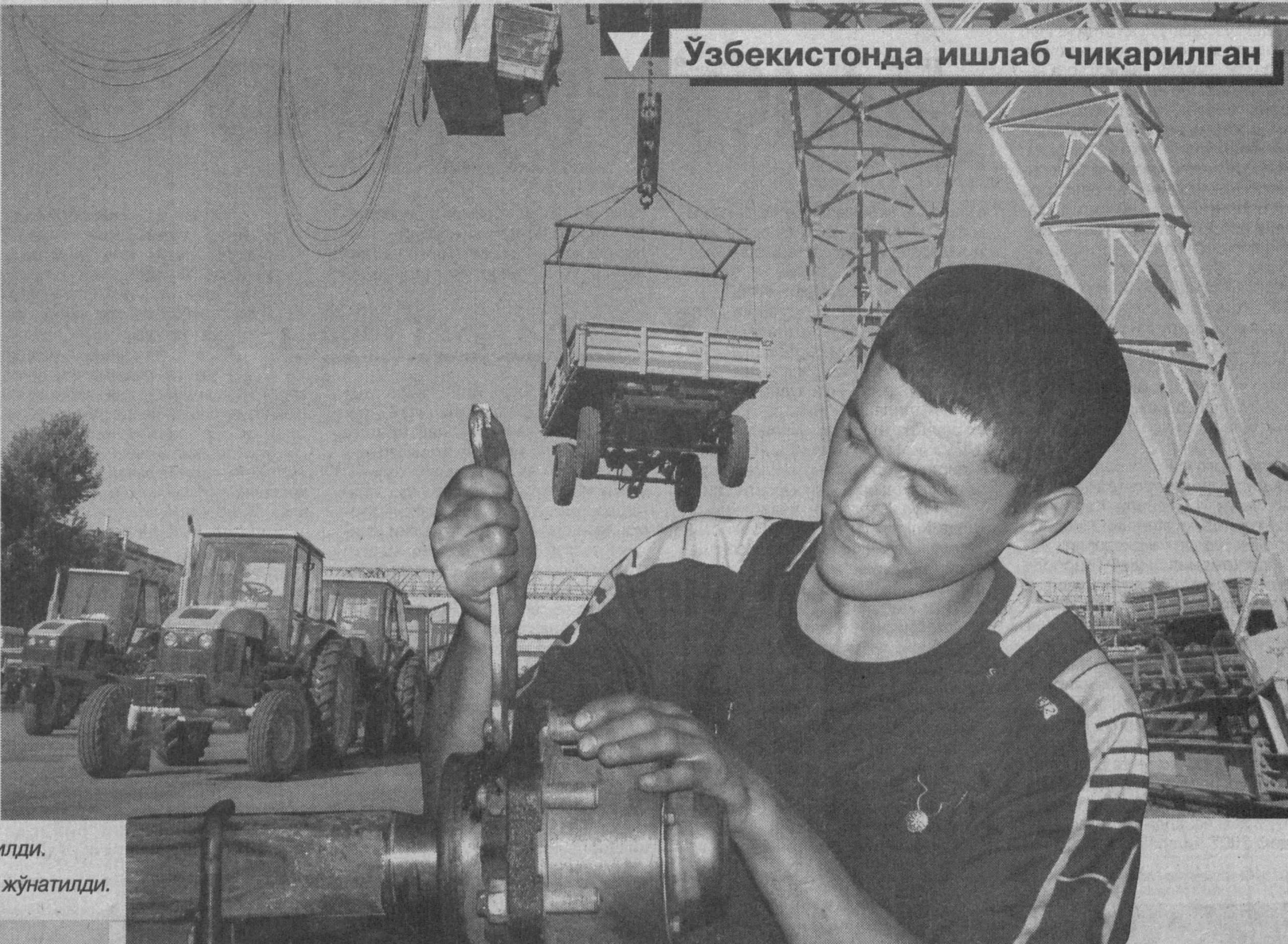
Ўзбекистонда ишлаб чиқарилган

очиқ акциядорлик жамияти Туркменистоннинг "Туркман- пахта" давлат концернига умумий қиймати 3,03 миллион АҚШ долларига тенг бўлган 1008 та трактор тиркамаси етказиб бериш бўйича шартнома имзолаган эди. Корхонада бугунга қадар 336 та трактор тиркамаси тайёрланиб, маҳсулот топши- риш майдончасига келтириб қўйилди. Шунинг 150 таси буюртмачига жўнатилди.