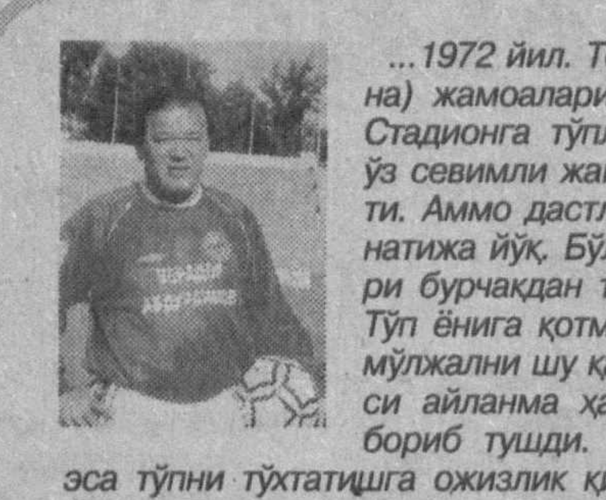
эса тўғри тўхташга оҳизлик қилди. Айни шу дамда стадион ишқибозлар ҳайриқирғидан ларзага келди. «Днепр» жамоаси мураббийи,

«Интерфакс» ахборот агентлигининг хабар беришича, Нижний Новгород (Россия) шаҳрида 20 ёшли енгил атлетикачи мусобақа вақтида вафот этган. Гувоҳларнинг маълумот беришларича, спортчи юз метрлик масофани югуриб ўтган бирдан ерга ётиб қолган ва бир неча дақиқадан сўнг юраги ўришдан тўхтаган. Иسمى ошкор этилмаган. Бу спортчи ҳаётлигида юрак оғирлигидан азият чеккан экан.