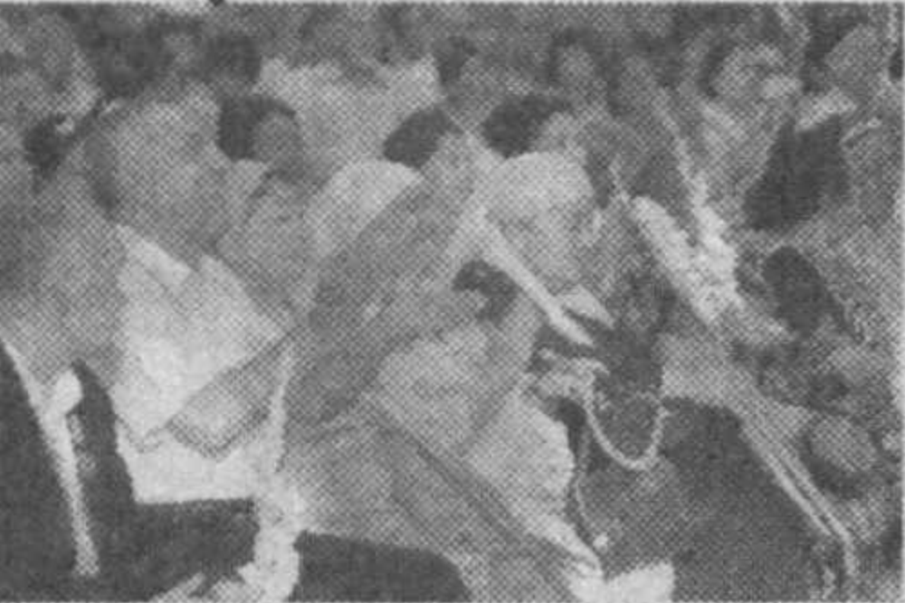
Ўзбекистон Маданият ва спорт ишлари вазирлиги, Республика халқ ижодияти ва маданий-маърифий ишлар илмий-методик маркази, миллий телерадиокомпанияси, Оксоқоллар Кенгаши, «Нуроний», «Маҳалла» ва халқаро «Олтин мерос» жамғирмалари ҳамкорлигида ташкил этилган ушбу тадбирда Қоракўлпоғистон Республикаси, вилоятлар ва Тошкент шаҳридан келган 18 нафар нуроний хаваскор қатнашди.

Пойтахтимиздаги Фафур Фулом номли маданият ва истироҳат боғида мустақиллиқнинг 16 йиллигига бағишланган санъат байрами бўлиб ўтди.