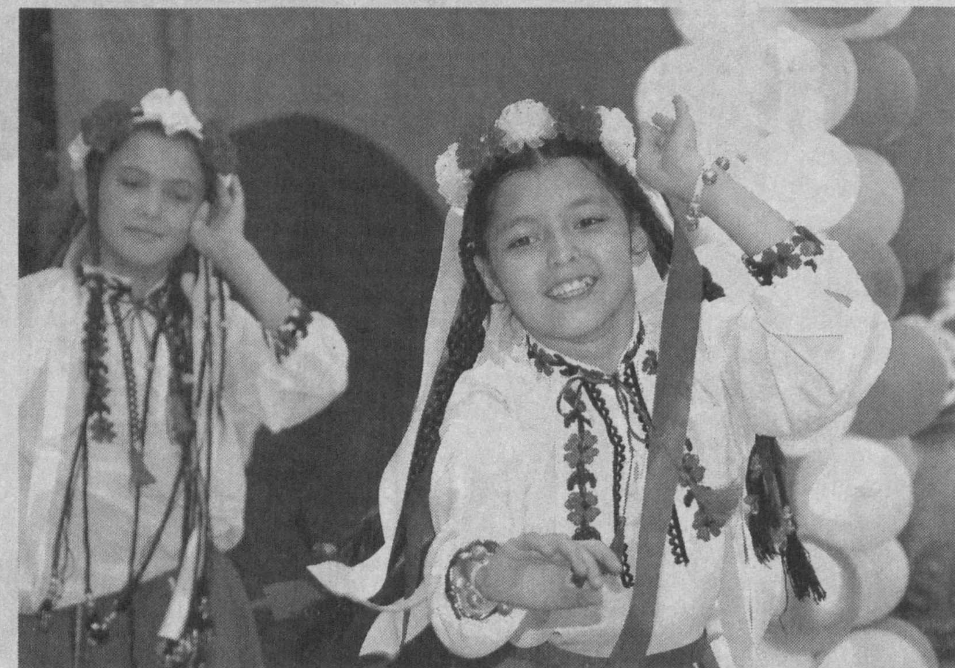
(Давоми. Боши 1-бетда).

Мамлакатимизда бугунги кунда бир юз ўттиздан ортиқ миллат ва эллар ягона оила фарзандларидек яшаб, меҳнат