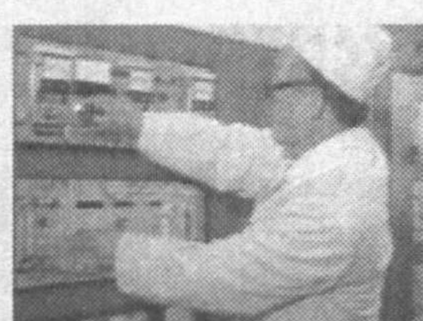
филишида расмий Пхеньян билан ядро объектларини тўхтатишнинг техник жиҳатлари келишиб олинган.

Корея Халқ Демократик Республикаси ўзининг барча ядро объектларини шу йилнинг охиригача ёпиши керак. Хитой, КХДР, АҚШ, Россия, Япония ва Корея Республикаси иштирокида ўтказилган олти томонлама музокараларда Америка делегациясини бошқарган Кристофер Хилнинг таъкидлашича, сўнгги ишчи гуруҳи йи-