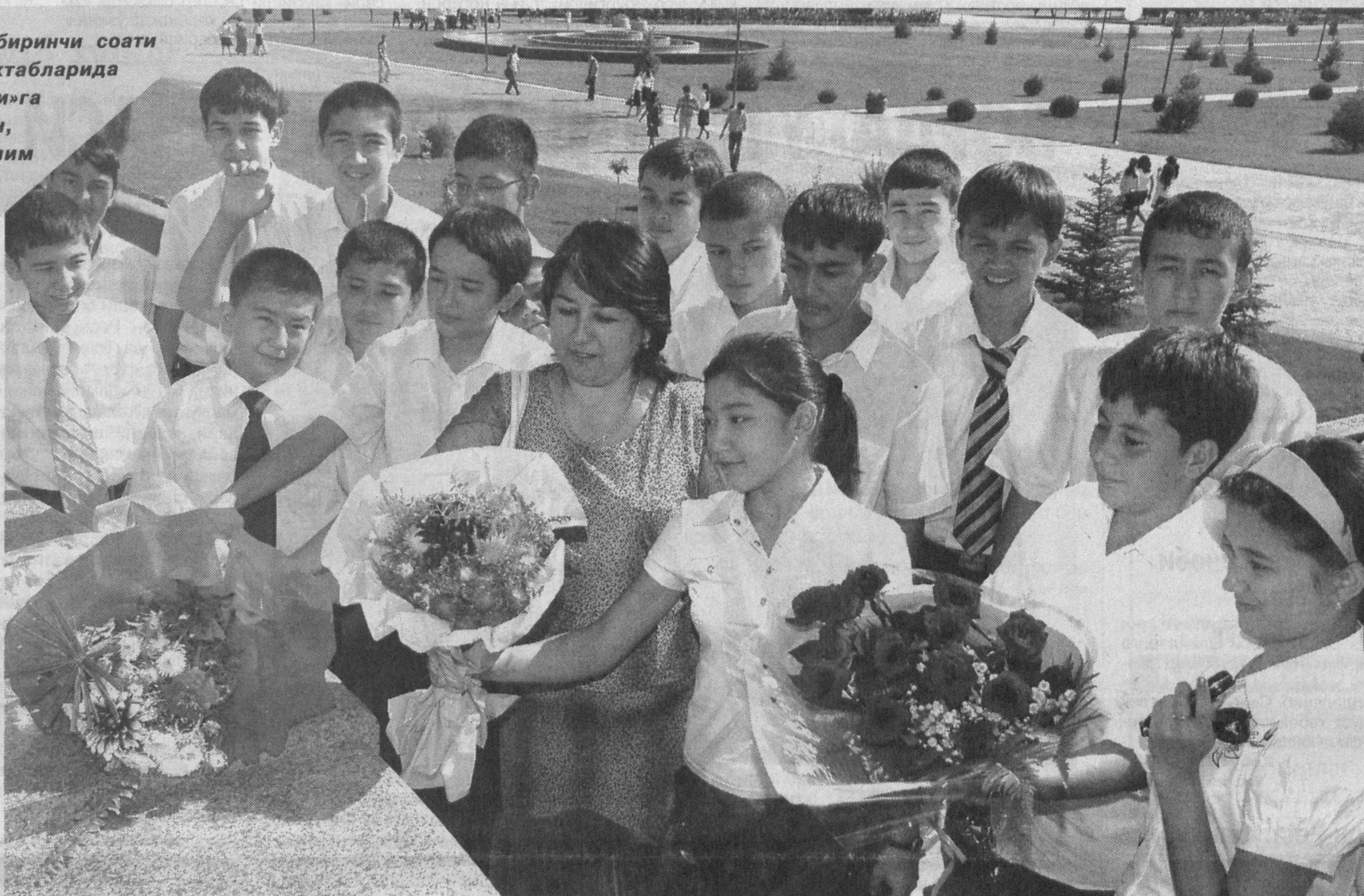
СУРАТДА: Мустақиллик майдонида Мустақиллик дарси.