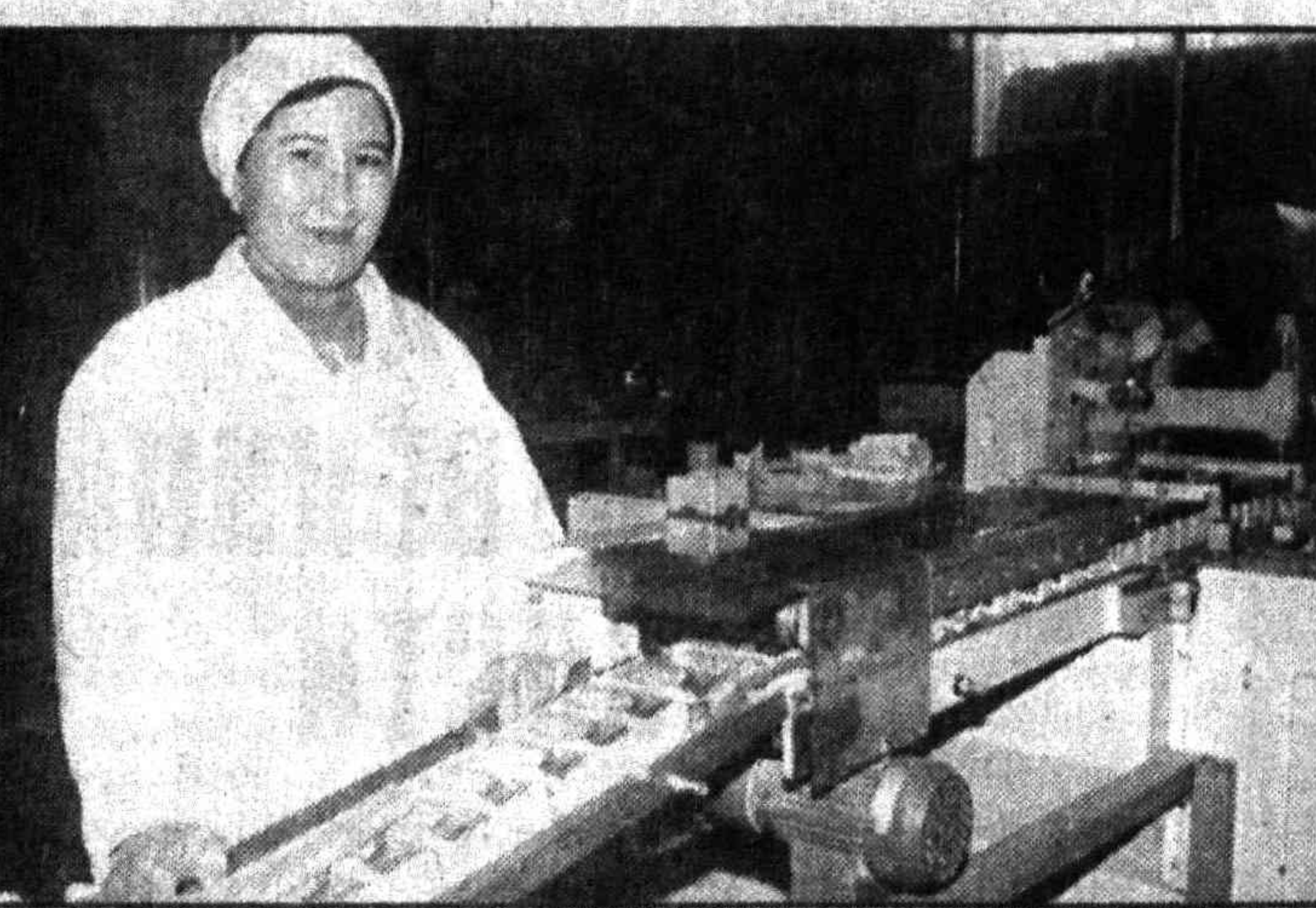
Всего же на кондитерской фабрике выпускают 17 видов печенья и 6 - вафель.

Всего за несколько лет кондитеры из Газалкента сумели прочно занять свою нишу на рынке продуктов питания.