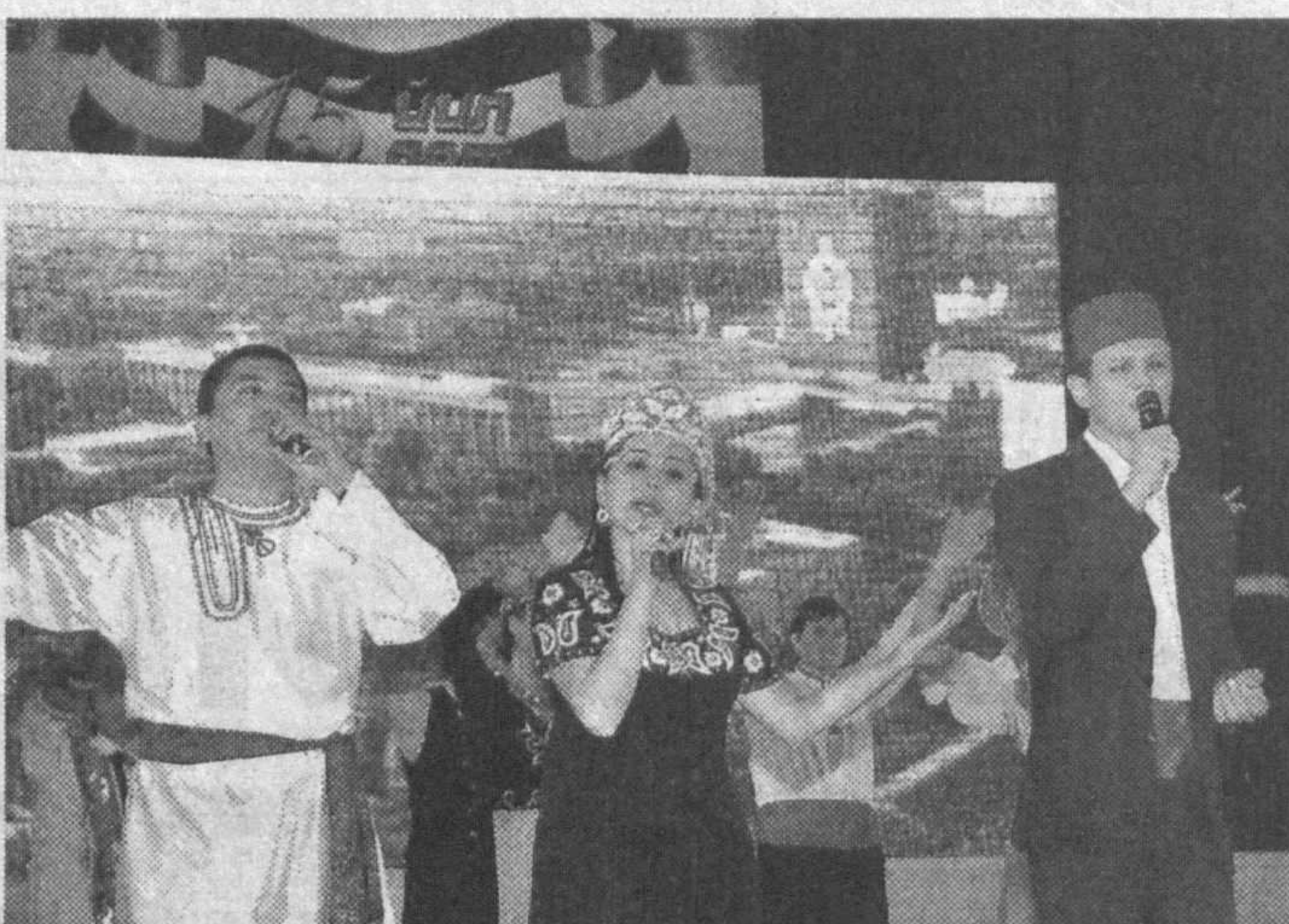
Ассоциация Қорақалпоғистон Республикаси, вилоятлардаги ўттиздан ортиқ корейс маданият марказларини бирлаштирган. Айни кунларда янги бина

Юртимизда Ўзбекистон корейс маданият марказлари ассоциациясининг ташкил этилиши, корейс халқининг урф-одатлари, анъаналари, тили ва маданиятини асраб-авайлаш, янада ривожлантириш борасидаги эзгу ишлар мамлакатимиздаги миллатлараро тотувлини таъминлаш борасида изчиллик билан амалга оширилаётган сиёсатнинг ёрқин ифодасидир.