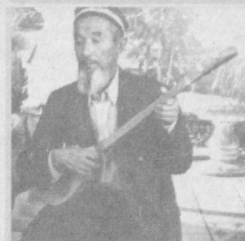
ТОҒДАН ОШГАН ДҮМБИРАМ... (1-4-саҳифаларда)

МАТЎБОТЧИЛАР ФАОЛИЯТИДАГИ ҚИЯГИРЛИКЛАР (1-2-саҳифаларда)