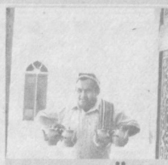
БИР ПИЁЛА ЧОЙИМИЗ БОР (1-2-саҳифаларда)

МАТЎБОТЧИЛАР ФАОЛИЯТИДАГИ ҚИЯГИРЛИКЛАР (1-2-саҳифаларда)