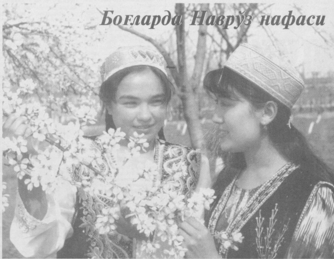
Боғларда Наврўз нафаси

● Фарғона шаҳридаги «Автоёна» акционерлик жамиятида автобил ойнаси ишлаб чиқарила бошланди.