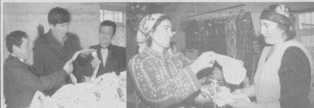
Ромитан туманидаги "РомСиб" Ўзбекистон - Россия қўшма қорхонаси пиллаи қайта ишлаш ва пахта толасидан тайёр маҳсулот, кийим-кечаклар ишлаб чиқаришга ихтисослашган. Бу ерда ишлаб чиқарилган маҳсулотлар қисқа муддат ичида харидорлар назарига тушиб улгурди.

/ Валюта қийматини белгилаш чоғида Ўзбекистон Республикаси Марказий банки мазкур валюталарни ўшбу қийматда сотиш ёки сотиб олиш мажбуриятини олман.