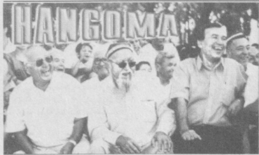
УЗУН СОЧЛИ "ЖОРЖ"