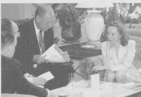
«Интерконтинентал» меҳмонхонасида бизнес-форумнинг тантанали очилиш маросими бўлиб ўтди.

Семинар иштирокчилари Ўзбекистон катта инвестиция салоҳиятига эга эканлигини ва ундан самарали фойдаланиш зарурлигини таъкидлади. Қайд этиш керакки, кейинги йилларда республикада хорижий инвестицияларни жалб қилиш шартлари яхшиланмоқда. Бу мамлакатимизда амалга оширилаётган иқтисодий ислохот-