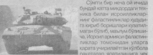
Сўнгги бир неча ой ичида бундай катта миқдордаги техника билан исроилликларнинг фаластинликлар ҳудуди-га кириб боришлари кузатилмаган бўлиб, маълум бўлишича, Исроил армияси фаластинликлар томонидан уларга қарата учираётган қўлбола ракеталар яратилишига чек қўйиб мақсадда мазкур операцияни бошлаганлар.

"Ha-aretz" газетасининг ёзишича, кеча 70 га яқин Исроил танклари Байт-Хонун шаҳридаги Фаластин ҳудуди-га бостириб кирганлар.