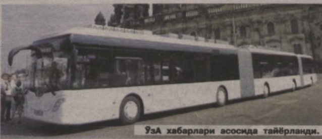
Ўза хабарлари асосида тайёрланди.

Маҳаллий матбуотнинг тарқатган хабарларига кўра, мазкур "Autotram" автобусининг узунлиги 30 метр, кенлиги 2,55 метр, баландлиги эса 3,4 метрга тенг. У бир вақтнинг ўзига 256 йўловчига хизмат кўрсата олади.