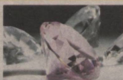
Шри-Ланкада ўтган "Facets Sri Lanka" заргарлик буюмлари кўргазмасида ўғрилик содир бўлди.