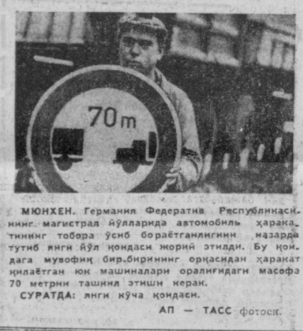
МЮХЕН. Германия Федератив Республикаси...