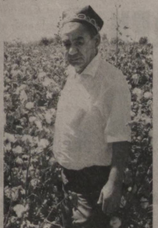
Мелиоратив ҳолати мураккаб.

Марҳамат туманидаги "Мақсудов" фермер ҳўжалигининг далалари адир ён бағрига жойлашган.