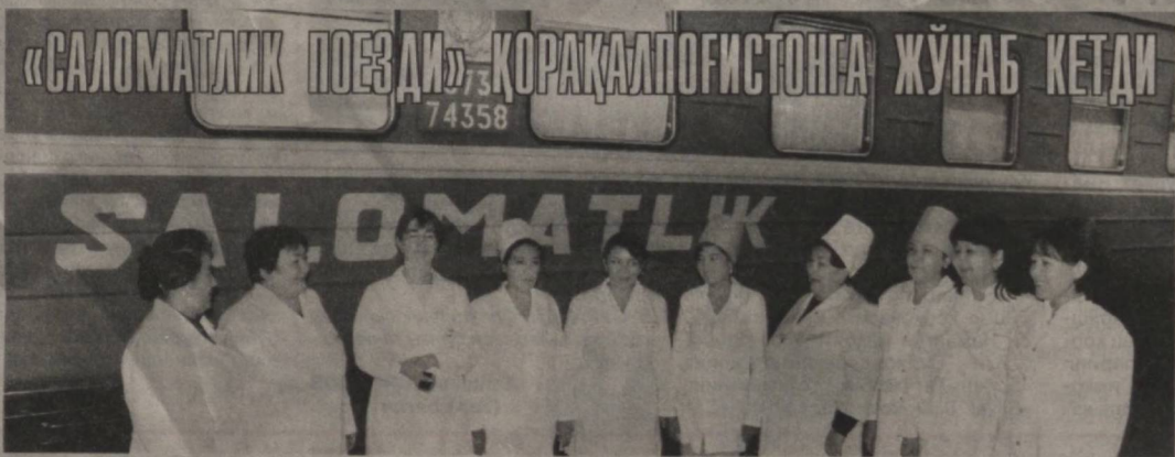
Президентимизнинг 2012 йил 27 февралдаги "Мустаҳкам оила йили" Давлат дастури тўғрисидаги ҳамда "2009-2013 йилларда аҳолининг репродуктив саломатлигини мустаҳкамлаш, соғлом бола туғилиши, жисмоний ва маънавий баркамол авлодни воғга етказиш борасидаги ишларни янада кучайтириш ва самарадорлигини ошириш чора-тадбирлари дастури тўғрисида"ги Қарорлари ижросини таъминлаш, хусусан, Қорақалпоғистон Республикасининг чекка ҳудудларида