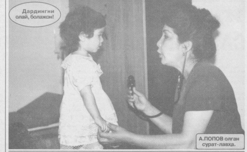
Дардингни олай, болажон!

Боланинг бўш вақти қандай? Боланинг бўш вақти қандай? Боланинг бўш вақти қандай?