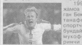
1996 йил терма жамоа сафига қўшилган Бекхэм 34 йиллик танаффусдан сўнг спортчилар орасида бундай ордени билан мукофотланган биринчи вакил саналган.

МУНОСИБ ТАҚДИРЛАНДИ Англия терма жамоаси сардори, "Манчестер Юнайтед" клубининг ярим ҳимоячиси Дэвид Бекхэм ўтган ҳафта охирида нишонланган мамлакат кироличиси Елизавета IIнинг тузилган кунини муносабати билан Британия империяси ордени билан тақдирланди.