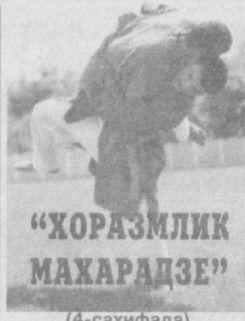
"ХОРАЗМЛИК МАХАРАДЖЕ" (4-саҳифада)