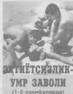
ЭХТИЁТСИЗЛИК-УМР ЗАВОЛИ (1-2-саҳифаларда)