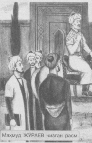
Маҳмуд ЖҰРАЕВ чизган расм.