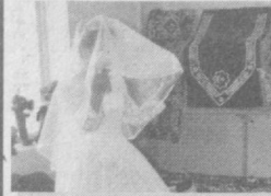
СОҒЛОМ ФАРЗАНД-ЮРТ КАМОЛИ