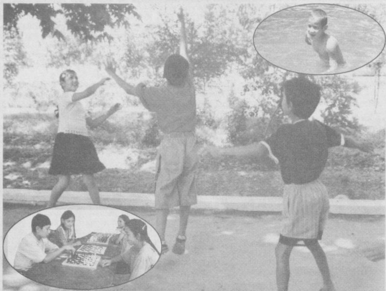
Айни пайтда Қасби туманидаги Ф.Мусин номи болалар оромгоҳида 120 нафар бола ёзги таътилни кўнгилдагидаёқ ўтказмоқда. Оромгоҳни Алишер Навоий номи ширкат хўжалиги хомийликка олган. Ушбу масканда болаларнинг энг сеvimли машғулоти - шахмат-шашка каби спорт мусобақаларини ўтказиш аёнага айланган. СУРАТЛАРДА: оромгоҳда ёзги таътилни ўтказётган болалар ҳаётини давлалар.

Рустамжон УММАТОВ, "Қишлоқ ҳаёти" мухбири.