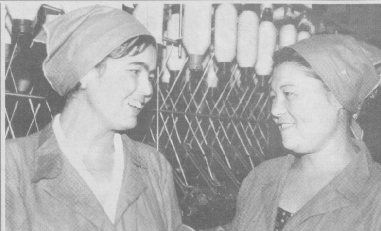
Гулистондаги "Зилола" очик ҳиссадорлик жамятида пахтадан ип калава йиғириш кенг йўлга қўйилган. Ишлаб чиқарилган маҳсулот нафақат юртимиз, балки қўшни давлатларга ҳам сотилмоқда.

Ортиқали НОМАЗОВ, "Қишлоқ ҳаёти" мухбири.