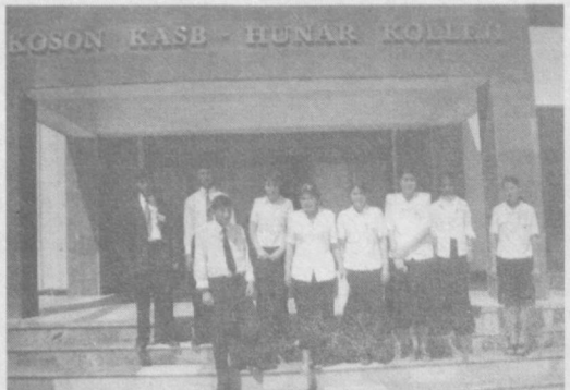
(Боши 1-бетда) Ўтган ўқув йилида жами 330 нафар ўқувчилар таълим...