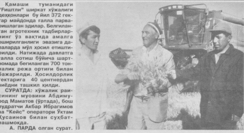
Камаша туманидаги "Фишл" ширкат хўжалиги деҳқонлари бу йил 372 гектар майдонда галла парваришлаган эдилар. Белгиланган агротехник тадбирларнинг ўз вақтида амалга оширилганлиги эвазига далаларда мўл ҳосил етиштирилди. Натijaда давлатга галла сотиш бўйича шартномада белгиланган 700 тонналик режа ортиги билан бажарилди. Ҳосилдорлик гектарига 40 центнердан зиёдин ташкил қилди.

Toshkent shahar Sobir Rahimov tumani hokimligi to-mo-nidan 1996 yil 24 iynal ruyxatga olingan "Tant'yema" masulyi-yati cheklan-gan jamiatni tugatildi. Davolov eylon bo-silgan kundun boslab bir oy mobayinda kabul kilinadi.