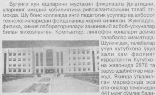
Бугунги кун ёшларини мустақил фикрлашга ўргатишни, уларнинг ижодий қобилиятини ривожлантиришни талаб этмоқда. Шу босқ коллежда янги педагогик усуллар ва ахборот технологияларидан фойдаланиш жорий қилинган.