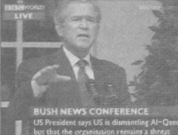
BUSH NEWS CONFERENCE US President says US is dismantling Al-Qaeda but that the organization remains a threat.

Оқ уйда оммавий ахборот воситалари билан матбуот анжумани ўтказган АҚШ президенти Жорж Буш Ироқ, Яқин Шарқ, Шимолӣ Корея, терроризм ва мамлакатнинг ички масалаларига тўхтади.