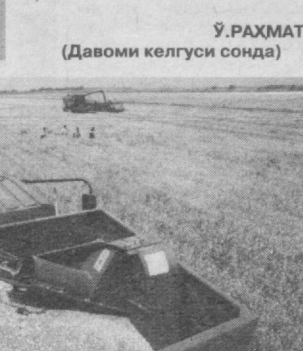
Ў.РАҲМАТ (Давоми келгуси сонда)

сотиб олишга мажбур эдик. Шунинг ўзи 350-400 миллион долларга тушарди. Ўша йиллар пахта пулининг кўп қисми нонга кетарди, десам янглишмаган бўламан. Изчил олиб борилган амалӣ ишлар натижасида кейинги йилларда тўлиқ ўзимизни дон билан таъминлашга эришдик. Президентимиз масалани кўндаланг қўйди: галла мустақиллигига эришимиз шарт. Галла мустақиллигига эришиш ҳаракатлари бошланган дастлабки йилларда республика бўйича сугорма ерлардан ўрта хисобда 21-22 центнердан хосил олинарди. Шунинг учун баъзилар: "Нима учун унумдор ерларга пахта ўрнига хосилдорлиги паст бўлган галла экишимиз керак?" дея норози бўлишган эди. Бироқ бу борада бошланган кенг кўламли ислохотлар натижасида республикаимизда галла