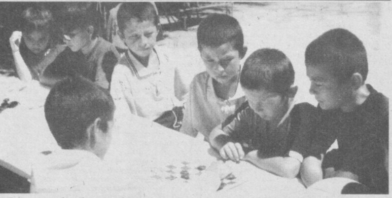
Болалик - бегуборлик, билимга, спортга чанқоқлик, дегани. Сиз тасвирда кўриб турган мана шу болалар орасидан келгусида кимлар етишиб чиқмайдилар, дейсиз. Бири олим, бири санъаткор, яна бири машхур спортчи, киноактер. Бугун эса улар мазаза қилиб дам оlishмоқда.

жоннинг кўшиқлари ҳаммага манзур эди. Яқинда республика овоз ёзиш студияси томонидан унинг сараланган кўшиқлари жамланган видеокассетаси санъат шинавандалари ҳуқмига ҳавола этилди.