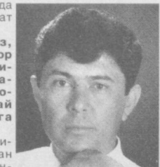
жоннинг кўшиқлари ҳаммага манзур эди. Яқинда республика овоз ёзиш студияси томонидан унинг сараланган кўшиқлари жамланган видеокассетаси санъат шинавандалари ҳуқмига ҳавола этилди.