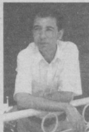
Узум узатиб турган наравонлари Ватандир.

Опанг солган уйлар бу - синчлари - бардошларга, Токлари ўшбар кетар мўйсифид элдошларга, Толлар узра чўзилиб кўлар, ой, кўшларга