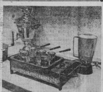
Рўзгор буюмлари ва турли анжомларни ишлаб чиқараётган корхоналарнинг меҳнатнашлари бир бекларнинг меҳнатини енгиллаштиришдан кўп фойдаланишлари тайёрлашди. Уларнинг айримлари СССР Халқ хўжалиги ютуқлари виставасида очилган «Енгил, озик-овқат санобати ва рўзгор приборлари учун машинасозликнинг эришган ютуқлари ва таркибидеги истиқболлари» кўргазмасида намойиш этилмоқда.

Ахил келиб қараса, бугдойи анча қуяйиб қолган. Ахил ҳам укаси ўйлади. — Мен-ку уйланганман, бола-чакам бор, укам бўлса ҳали уйланмаган, унга ёрдам берай, уй қуриб олсин, уйлانسин, — деб ўз улушидан тўрт беш галвир бугдойни олиб ахилга берди.