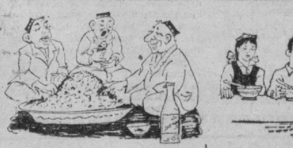
Чойхонада қуюғи. Оилада суғуғи.

толасидан тўйилган ва жун газламалардаги ностметик воситалардан тўшган доғлар новшадди спирти билан артиб кетказилди. Кейин буюмини сувда яхшилаб чойингиз. * Қийимга ёни буюмларга теккан сибҳ доғини илтиқ сут ёни қатинда ҳўлланган латта билан артиб кетказиб олади. Доғ ҳалдеганда кетавермаса, газламанинг доғи жойини сут ёни қатинда бироз солиб қўйиб артиг, олдин илтиқ сувда, кейин совуқ сувда чайиш керак.