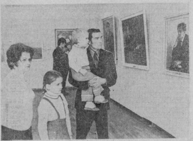
Шахримиздаги Ўзбекистон ССР Давлат санъат музейи заллари ҳар кунин узоқликдан келган томошабинлар билан гавжум бўлади. СУРАТДА: томошабинлар экспонатларни зўр қизиқиш билан кўздан кечиришмоқдалар.

Лекин 1970 кейинчалик 1972 йил охирига келиб, тасаддайлар осмон қушида учиб келадиган фаршталар ҳам ўзларига ўхшаган одам эканлигини тушуниб қолдилар. Фақат экспедицияларга бошчилик қиладиган Мануэль Элисалдегина