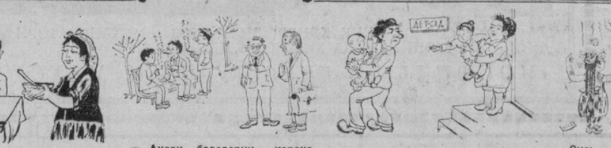
— Анави болаларни қарағи, палирос, чекишяпти. — Булар менинг болаларим эмас... Тарбиячи: — Хой, муллана, сиз бошқа болани олиб кетсангиз, ўғингизиз мана-у.