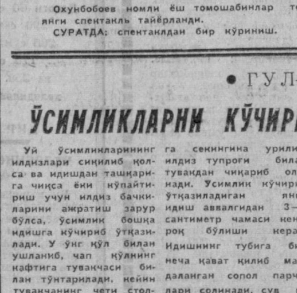
Оқунбобоев номли ёш томошабинлар театрида А. Дюманинг «Уч мушкетёр» романи асосида янги спектакль тайёрланди.