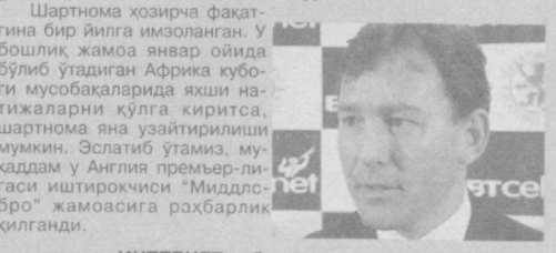
Шартнома ҳозирча фақатгина бир йилга имзоланган. У бошқарма жамоа январ ойида бўлиб ўтадиган Африка кубоги мусобақаларида яхши натижаларни қўлга киритса, шартнома яна узайтирилиши мумкин. Эслатиб ўтамоки, муқаддам у Англия премьерлигаси иштирокчиси "Миддлсбро" жамоасига раҳбарлик қилган.

Нигория терма жамоаси бош мураббийи этиб Англия футбол клубузи, терма жамоанинг собиқ сардори Брайан Робсон тайинланди.