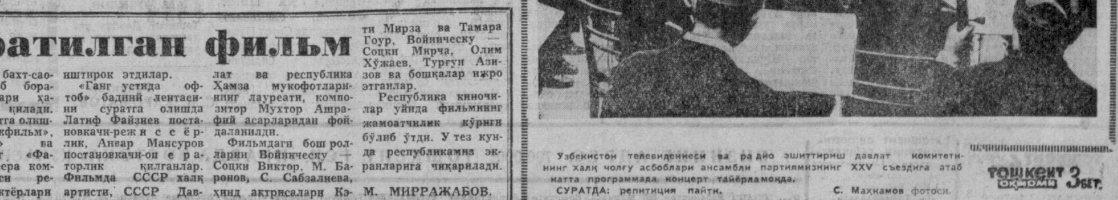
Ўзбекистон телевидениеси ва радио эшиттириш давлат комитетининг халқ чоғу асбоблари ансамбли партиянинг XXV съездида атаб катта программада концерт тайёрламоқда. СУРАТДА: репетиция пайти. 9 ФЕВРАЛЬ, 1976 й.

Тошкент тўғримаччилик ва енгил санъат институтида миниатюра театри иш бошлади. Тўғракича барча факультетлар ва тайёрлов бўлимининг студентлари актив иштирок этмоқдалар. Студентлар ҳафтада икки марта ўтказилаётган машғулотларда саҳна нутқи, юмористик образлар яратиш сирлари ҳақида маълумот олмоқдалар. Тўғракича иштирокчиларни дастлабки кўнгли саҳналарини тайёрлашга киришдилар. Улар репертуарида ўзбек ва қардош халқлар сатирик азувчиларининг асарлари бор. Тўғракича минатура устаси Х. Пўлдошев раҳбарлик қилмоқда. Қ. МАЛИКОВ.