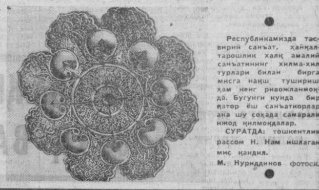
Республиканимизда таъбирий санъат, ҳайкалтарошлик халқ амалии санъатининг хилма-хил турлари билан бирга мисга наҳш тушириш ҳам нег ришонланмоқда. Бугунги кунда бир қатор ёш санъаткорлар ана шу соҳада самарали иш қилмоқда. СУРАТДА: тошентаник рассом Н. Нам ишлаган мис қандали.

Атоқли совет коммунист-шояри, Совет Иттифоқи Қаҳрамони Муса Яхияев туғилган кунига 70 йил тўлмоқда. Шу муносабат билан СССР Ёзувчилар союзи раислиги секретари М. К. Лукин раислигида Ўзбекистоннинг юбилей комиссияси тўғрисида бўлиб ўтган биринчи мажлисида юбилейни ўтказиш планини муҳокама қилди. (ТАСС мухбири).