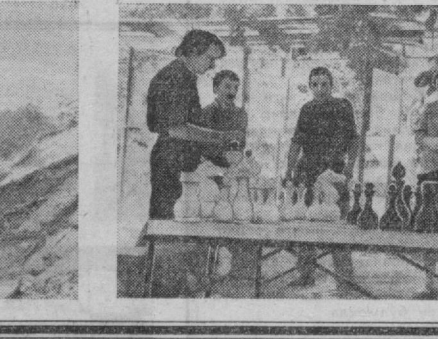
Мураббийлар сафини ўстириш корхона маъмуриятининг партия, касабасоюз ва комсомол ташкилотларининг ассосий вазифасига айланган. Бугунги кунда илгор ишчилар ишлаб чиқаришда 150 дан ортиқ меҳнат ветерани мураббийчилик ҳаракатида актив иштирок