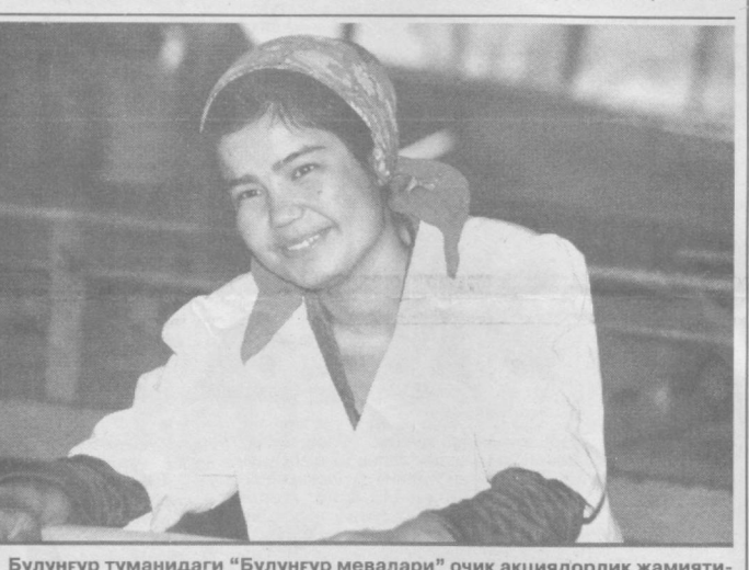
Булунгур туманидаги "Булунгур мевалари" очик акциядорлик жамиятида йил бошидан бун 80 тонна болғар қаламлари, 18 тонна пизё қуриптилиб, Германия ва Туркия давлатларига жўнатилди.