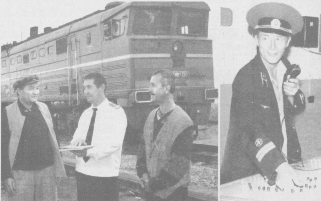
Конимех туманидаги "Қарақата" темир йўл бекати бундан уч йил олдин фойдаланишга топширилган эди. Янги бекатнинг фаолияти йўловчилар учун анчагина қулайликлар яратди. Мазкур бекатдан бир қатор поездлар қатнови йўлга қўйилган. Ҳозирда бу ерда 85 нафар киши иш билан таъминланган.

● Пойтахт ҳокимлигида шу йилнинг ноябрь-декабрь ойларида ўтказилажак фуқароларнинг ўзини ўзи бошқариш органлари га сайловга тайёргарлик кўриши ва уни ўтказиш масалаларига бағишланган семинар бўлди.