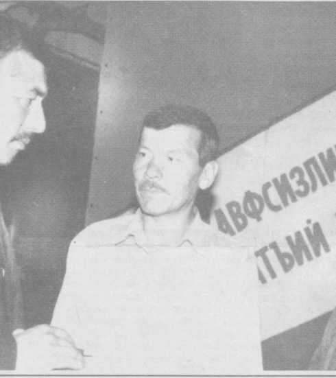
ОБОД МАҲАЛЛА ЙИЛИ: