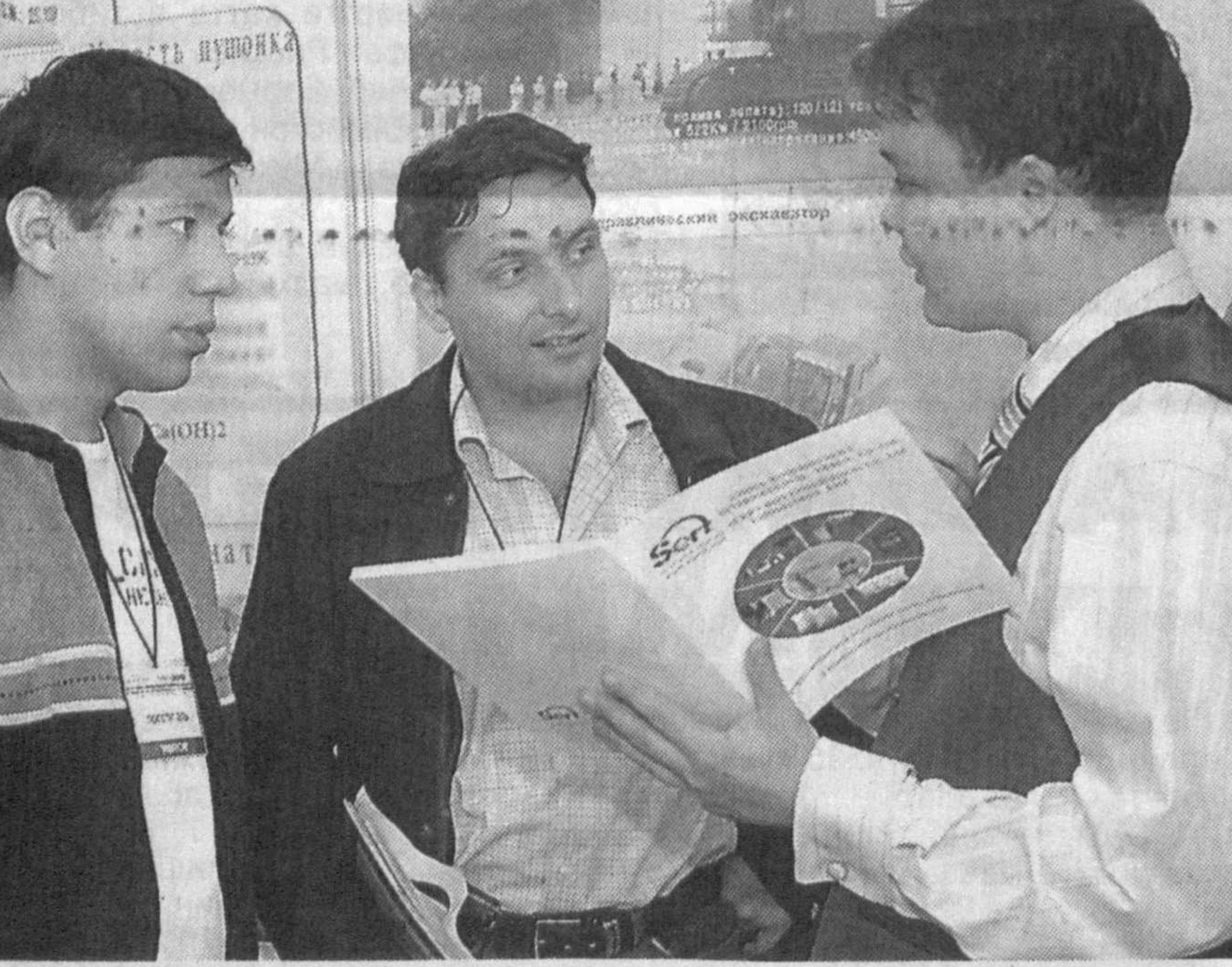
Технология жиҳозлаш бўйича тасдиқланган 9 та лойиҳанинг амалга оширилиши ҳисобига пўлат ишлаб чиқариш ҳажми 2011 йилга бориб, 2006 йиллардагига нисбатан 12,7 фоизга, навли прокат ишлаб чиқариш эса 12,3 фоизга ошди.

Кўрғазма павильонларидан қимё, нефть саноати учун ҳам ашё ва ускуналар, технологиялар, назорат-ўлчов асбоблари каби 40 дан зиёд экспозиция жой олган. Пластмасса ва резина бўлимида эса қачуқни қайта ишлаш учун техника ва ускуналар, экстрадур ва экстраузон қурilmалар, компрессорлар, турли хом ашёлар намойиш қилинмоқда.