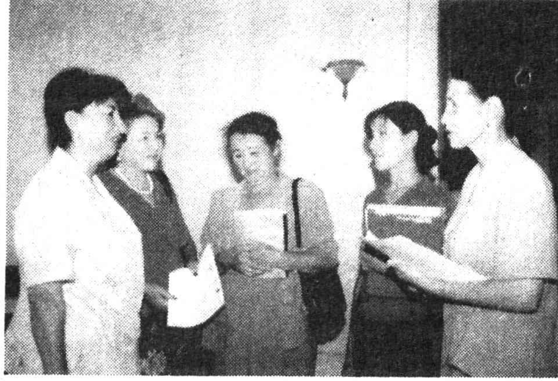
Отметив успехи, обсудили также и вскрытые недостатки и упущения.

Осуществлялись меры в рамках выполнения «Программы трудоустройства женщин на 2005-2007 годы».