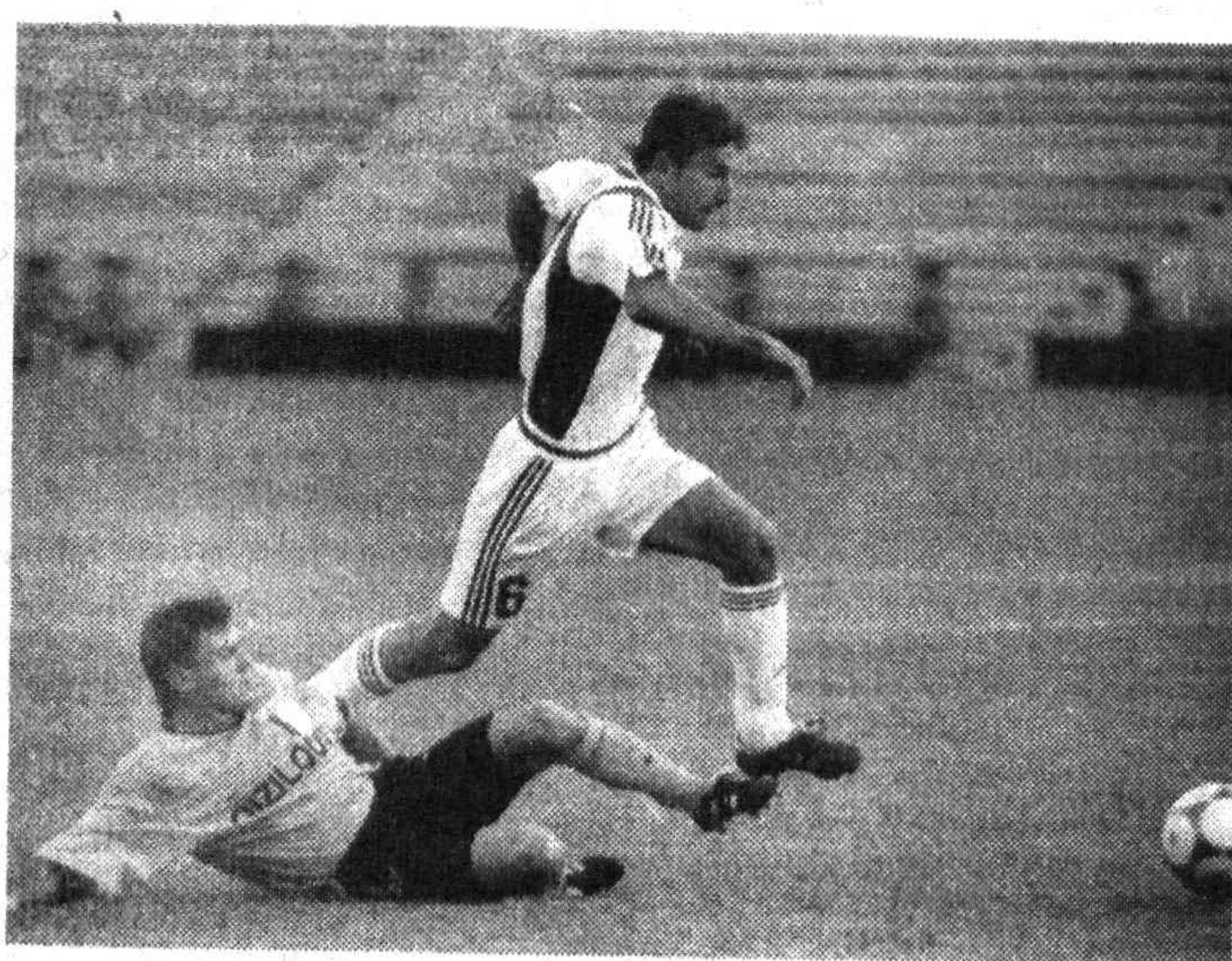
шел 27-28 июня. Встречались: «Кызылкум» - «Пахтакор» - 0:1, «Навбахор» - «Согдиана» - 4:0, «Машьял» - «Насаф» - 0:2, «Металлург» - «Трактор» - 1:2.

11-й тур чемпионата Узбекистана команд высшей лиги ознаменовался ниспровержением футбольных авторитетов. Сразу три претендента на медали потерпели поражения.