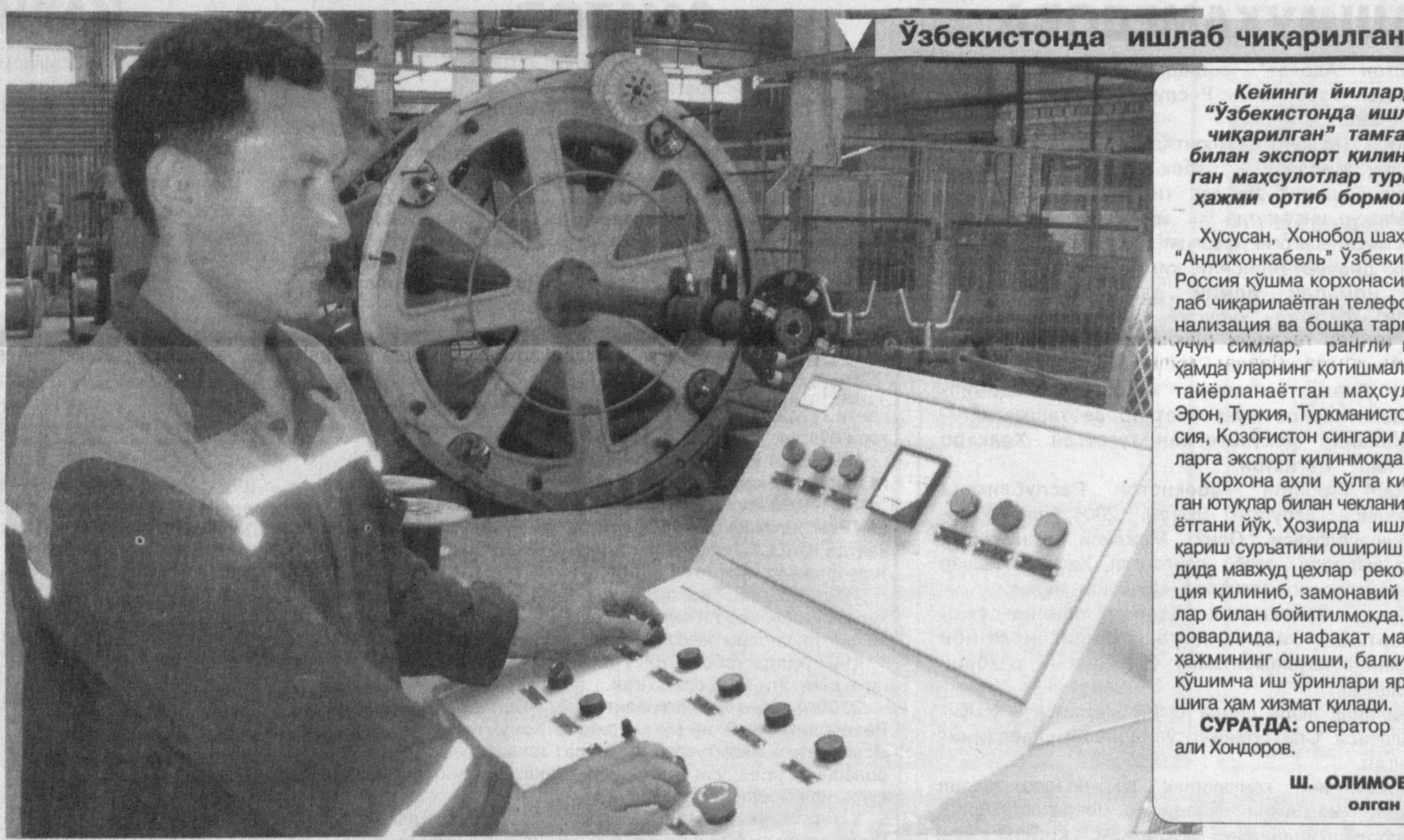
Ўзбекистонда ишлаб чиқарилган

Кейинги йилларда «Ўзбекистонда ишлаб чиқарилган» тамғаси билан экспорт қилинаётган маҳсулотлар тури ва ҳажми ортиб бормоқда.