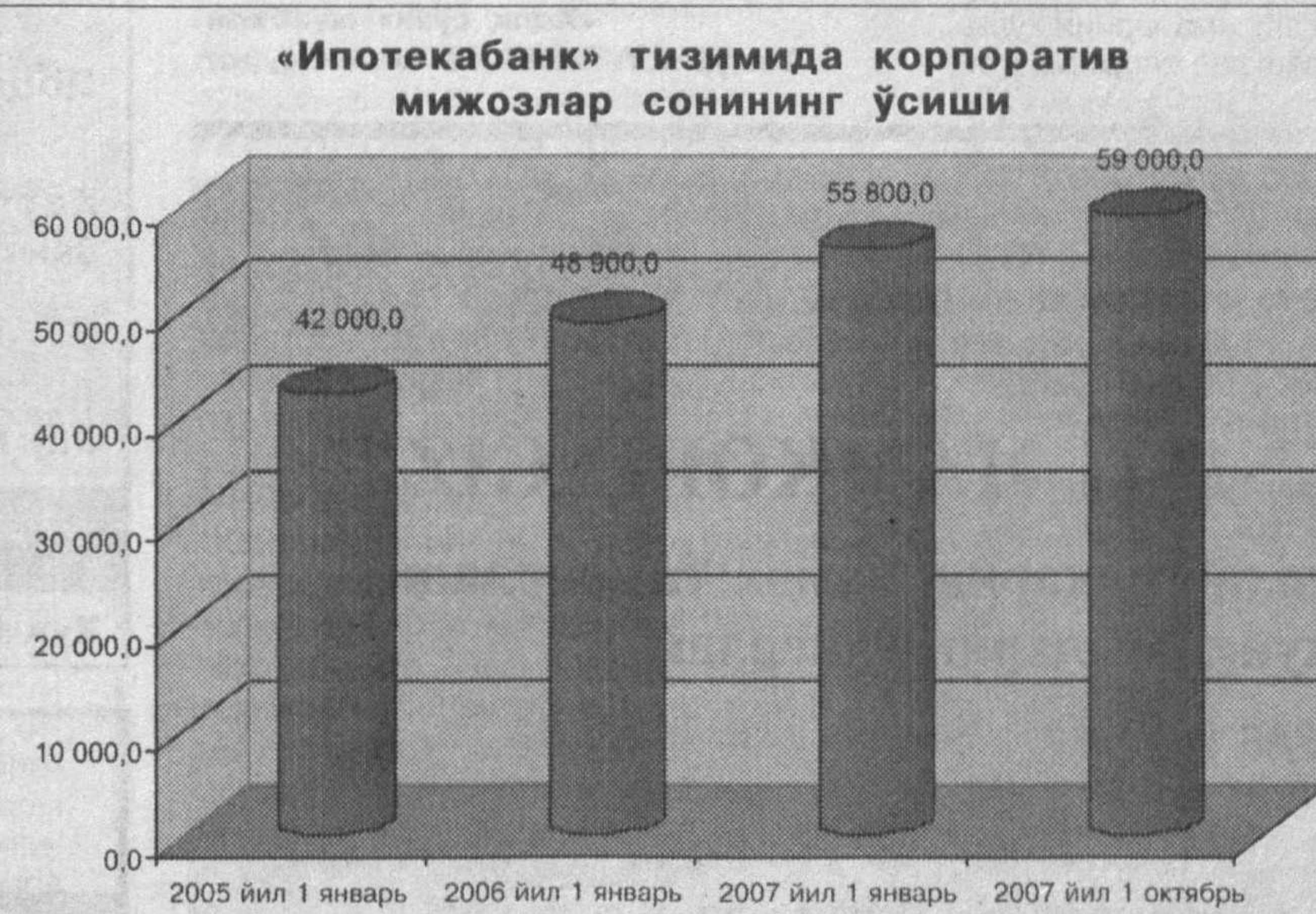
2007 йил 1 октябрь ҳолатига кўра, «Ипотекабанк»нинг кредит портфели жами 243,1 млрд. сўмни ташкил этиб, уни тармоқлар бўйича таснифлаганда, қуйидагиларни кўришимиз мумкин.