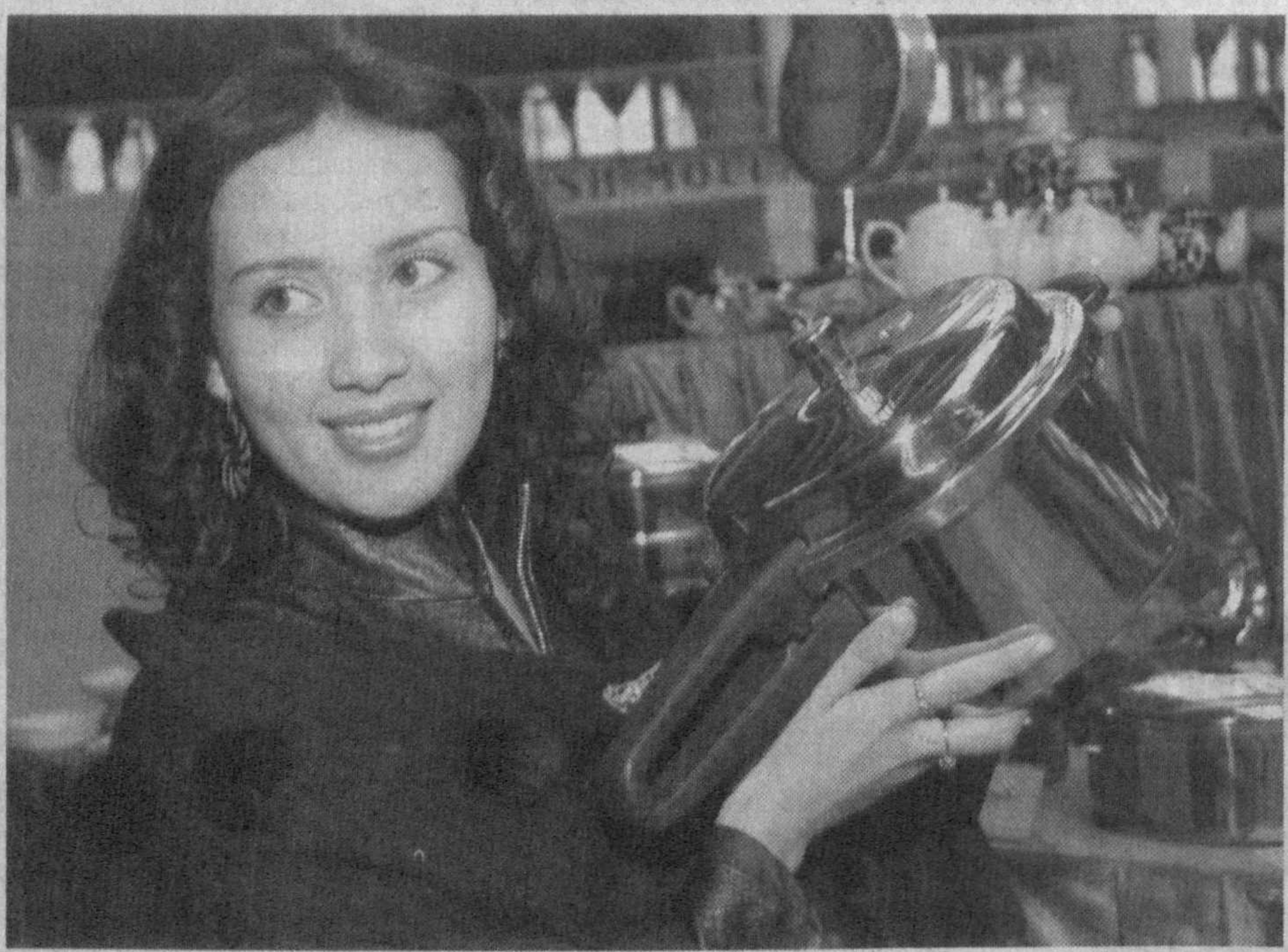
(Давоми. Боши 1-бетда).

до ярмаркаси ўтган йили махсус турдан келиб чиққан ҳолда саккиз жойда ўтказилган бўлса, жорий йилда истеъмолчиларга қулайлик яратиш мақсадида уч жойда ташкил этилди.