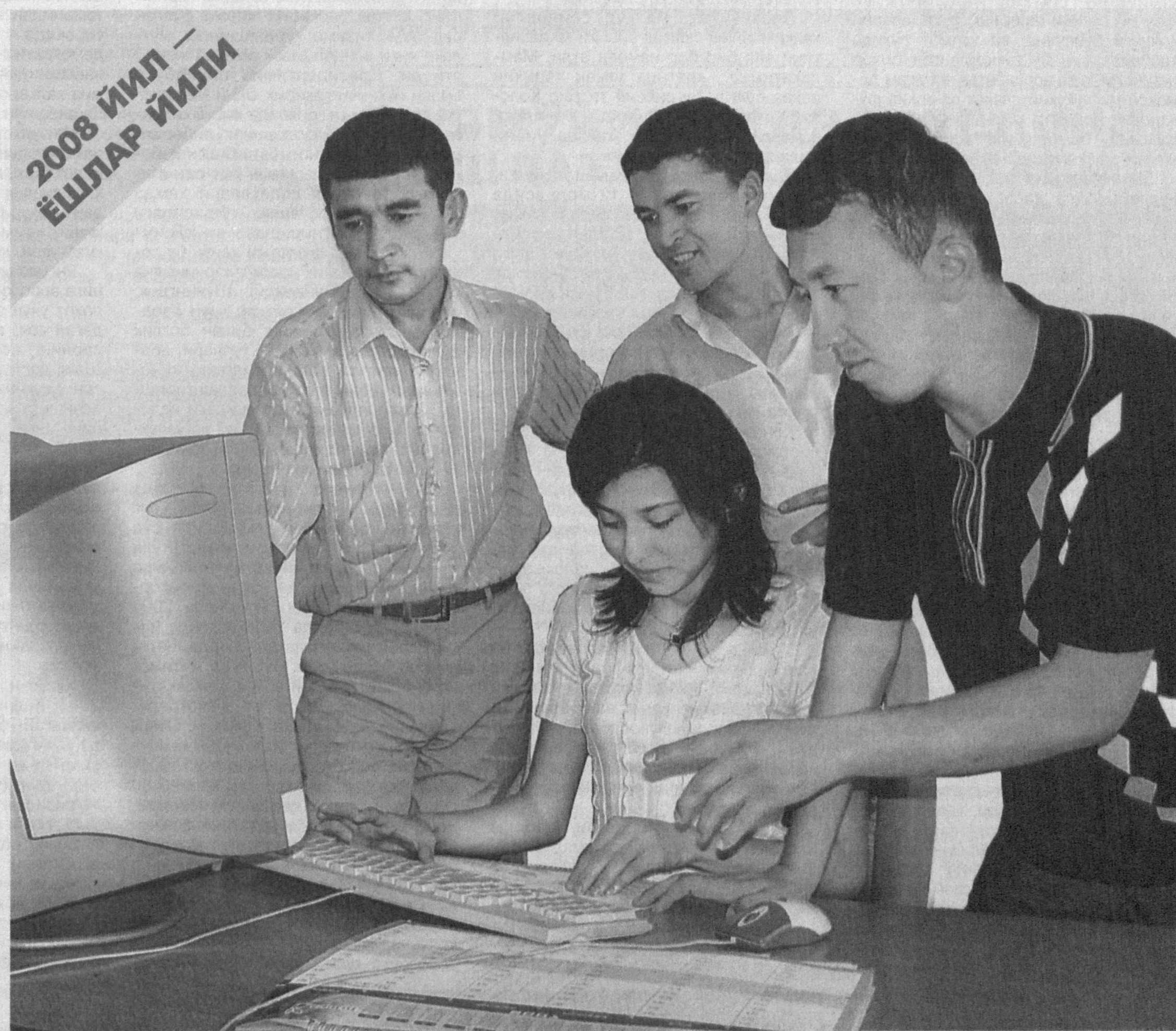
2008 йил — ЁШЛАР ЙИЛИ