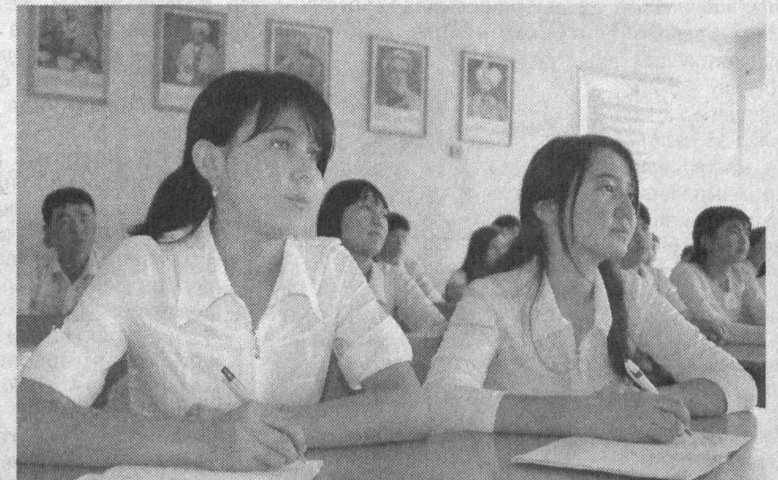
Айни пайтда олий ва ўрта махсус, касб-хунар таълими муассасаларининг ҳамкорлигини сифат жиҳатидан янги босқичга кўтариш...

Айни пайтда олий ва ўрта махсус, касб-хунар таълими муассасаларининг ҳамкорлигини сифат жиҳатидан янги босқичга кўтариш, олий таълимда тўпланган илгор тажрибаларни касб-хунар таълими тизимига жорий этиш мутахассислар тайёрлаш сифатини оширишнинг асосий омилларидан бири эканлигини ҳаётнинг ўзи кўрсатиб турибди. Бу борада Фарғона Давлат университетининг ўрта махсус, касб-хунар таълими муассасалари билан кенг қамровли ҳамкорлик дастури ишлаб чиқилди ва амалиётга татбиқ этилди. Дастурга мувофиқ бир қатор йўналишлар бўйича ижобий ишлар амалга оширилди. Аввало, университет илмий кенгаши таркибига 7 нафар, факультетлар кенгаши таркибига 24 нафар ўрта махсус, касб-хунар таълими муассасалари директорлари киритилди. Бу эса узлуқсиз таълим тизимидagi мавжуд муаммоларни биргаликда ҳал этиш, ҳамкорликни янада ривожлантириш учун кенг имконият яратди.