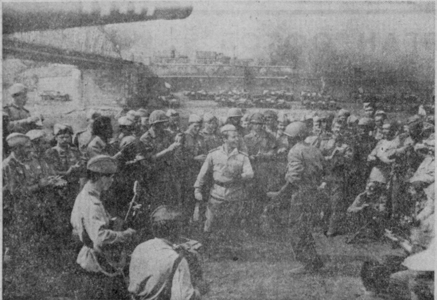
«МОСФИЛЬМ» КИНОСТУДИЯСИ МАҲСУЛОТИ.

КИШИНЕВ шаҳрида 1975 йилда ўтказилган БУТУНТИФИҚ КИНОФЕСТИВАЛИДА БУ ФИЛЬМ «КАТТА МУКОФОТ»га сазовор бўлди.