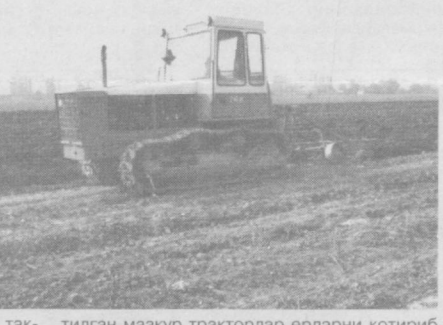
Халқимизда "Ер ҳайдасанг куз ҳайда, куз ҳайдамасанг юз ҳайда" деган нақб бор. Зеро, мутахассисларнинг ҳам, боғбону дехқонларнинг ҳам фикри шундай. Чунки бугун қилинган сифатли шудгор келгуси йил учун мустаҳкам пойдевор демак. Шунинг унутмасок бас. Саид РАҲМОНОВ, "Қишлоқ ҳаёти" мухбири.

Айтиб ўтиш керакки, хориждан келтирилган юқори унумли тракторлар фақат шудгор учун мўлжалланган, холос. Бироқ бизда бошқа юмушлар учун ҳам "Магнум" лар сафарбар этилмоқдаки, бу кўпчилик дехқонларнинг эътирозига сабаб бўлмоқда. Масалан, ҳайдалган майдонларни текислаш мақсадида кири-