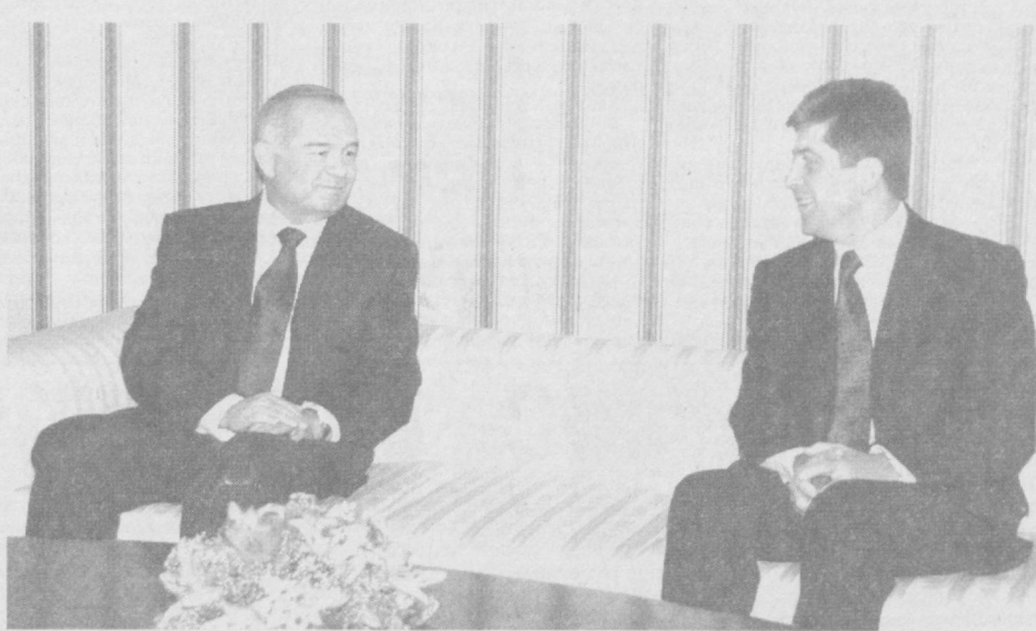
(София, 24 ноябр. Ўза мухбири Анвар Бобоев хабар қилади.) Ўзбекистонлик олий мартабали меҳмоннинг давлат ташрифи муносабати билан Болгария поётахти аэропорти, кўча ва ҳибонлари икки мамлакат байроқлари билан безатилади. София марказидаги «Авлиё Александр Невский» майдонида фахрий қоровул саф тортиди.

Ҳазрат Абдуллоҳиқ Гиждувоний ҳоқи мангу осойиш толган маскандадир. Бу ердаги улғур соқинлик, файз кўнглига ажиб бир сурур бахш этади, хотиржам тортади, фикр тиниқлашди. Узингизни энгил хис этасиз. Ўткинчи дунё ташвишларидан бир лаҳза холи бўласиз.