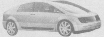
"HY-WIRE"ни келажак автомобили, дейиш мумкин. Компаниянинг мазкур автомобилини яратишидан яна бир асосий мақсади, ер юзидида қанчалардир деб ном қўйди. "HY-WIRE" ўтган йили Францияда бўлиб ўтган "Париж Автомобил кўргазмаси"да намойиш этилди. Унинг рули, тепкиси ҳам йўқ... Ениги масаласига келсак, у

бензин билан эмас, балки водород билан ҳаракатланади. Оғирлиги 2 тонна. Автомобилсозлар "HY-WIRE"нинг дизайни масаласига ҳам алоҳида эътибор қаратишган. Унинг ташқи кўриниши ҳам қандай захордо-р ўзига тортиши аниқ, Бунга шубҳа қилма-са ҳам бўлади.