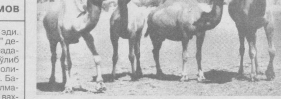
«Қоракалпоққоракўл» хиссадорлик жамиятига қарашли "Буҳан-Мерей" ширкат хўжалигида ҳақиқий ҳолат билан танишсангиз, юқоридики фикрлар ҳақиқий эканлигига амин бўлиш мумкин.