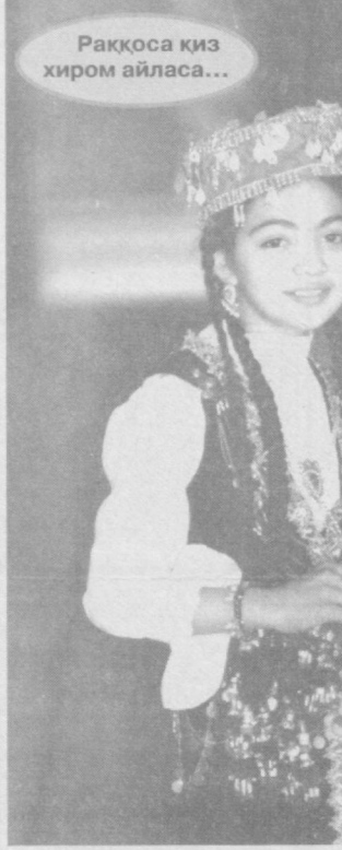
Раққоса қиз хиром айласа...

Эртаси кунини малакали муҳташасислар синоидан яхши ўтган бу Жавлон кўп ўтай болаларга мўлжалланган (ҳозирги "Келажак тонги") радио эшитиришида бошловчилик қила бошлади.