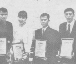
Учрашувда иштирок этган вакиллар билан.

Маълумки, фан юртимизда қўнғиний йиллик тарихга эгадир. Утмишда яшаб ўтган кўнғиний буюк алломаларимизни ҳали-ҳануз бутун жаҳон эътифори билан эътибор қозонди.