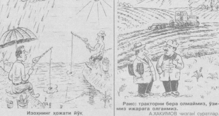
Рис: тракторни бера олмаимиз, ўзимиз ижарага олганмиз. А.ХАКИМОВ чизган суратлар.