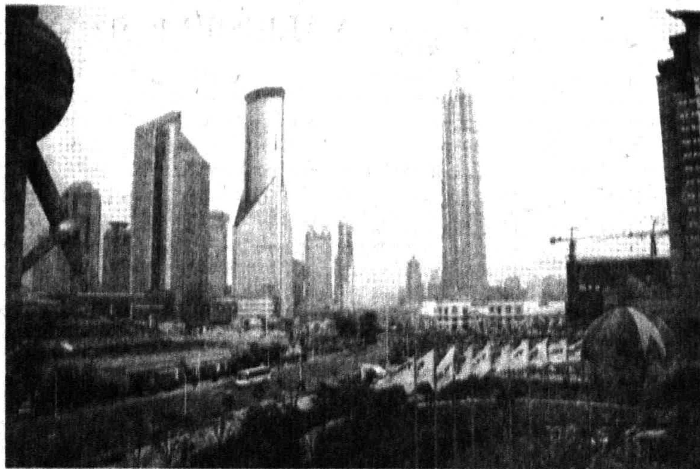
Небоскребы нового Шанхая.

Реформы начались повсеместно. Но стране нужен был осо-