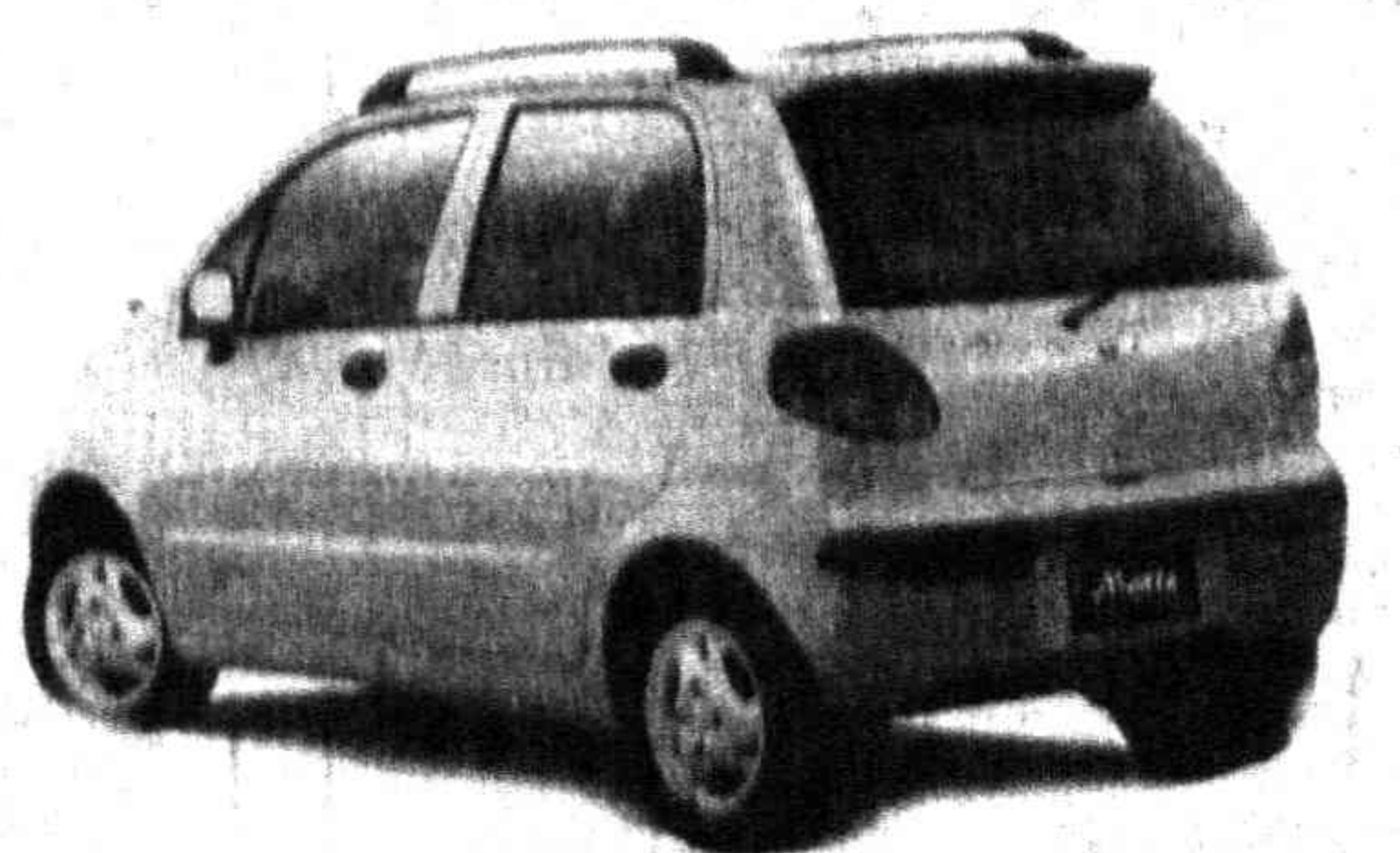
Полосу подготовил О. МАКАРЕНКО.

С этим автомобилем, отмечают самые авторитетные эксперты, Узбекистан, как производитель современной автомобильной техники, уверенно будет себя чувствовать и на европейском рынке. «Матиз» отвечает самым жестким стандартам, принятым в европейских странах по качеству, комфортности, безопасности, экологии. Не случайно многие считают, что с выпуском этой легковушки перед отечественным автомобилестроением открывается новый этап — этап еще большего укрепления позиций на мировом рынке.