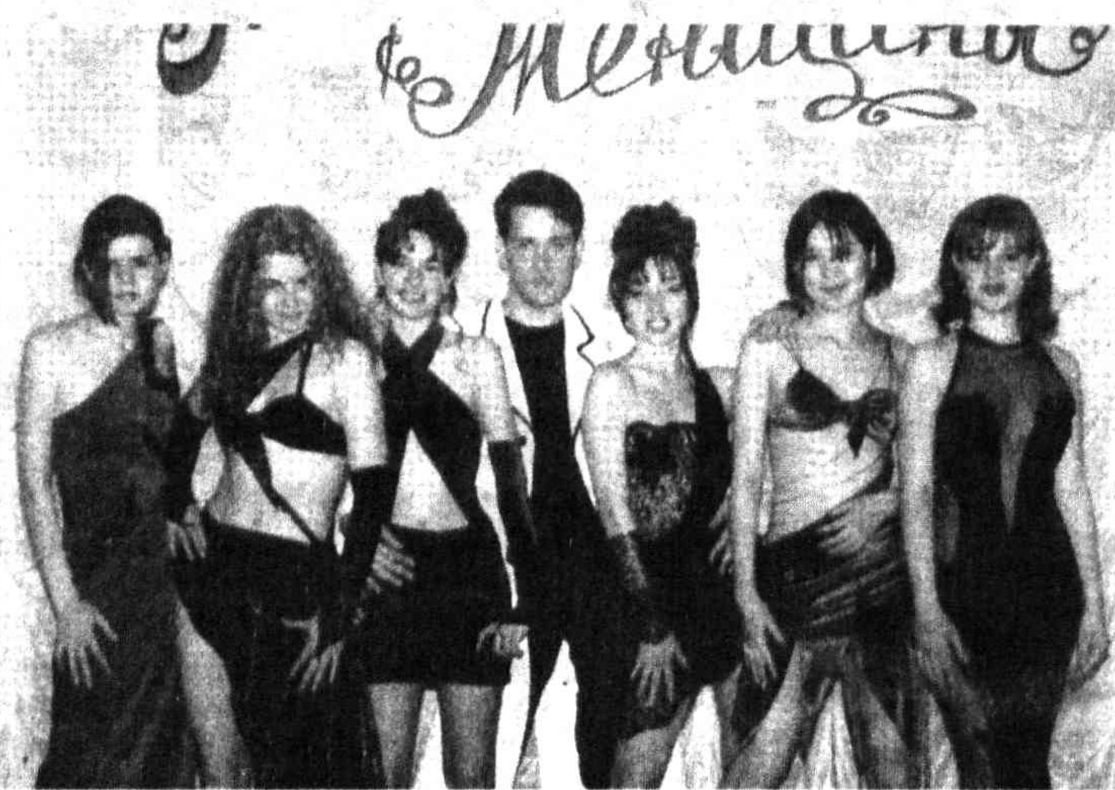
На снимке: во время фестиваля.