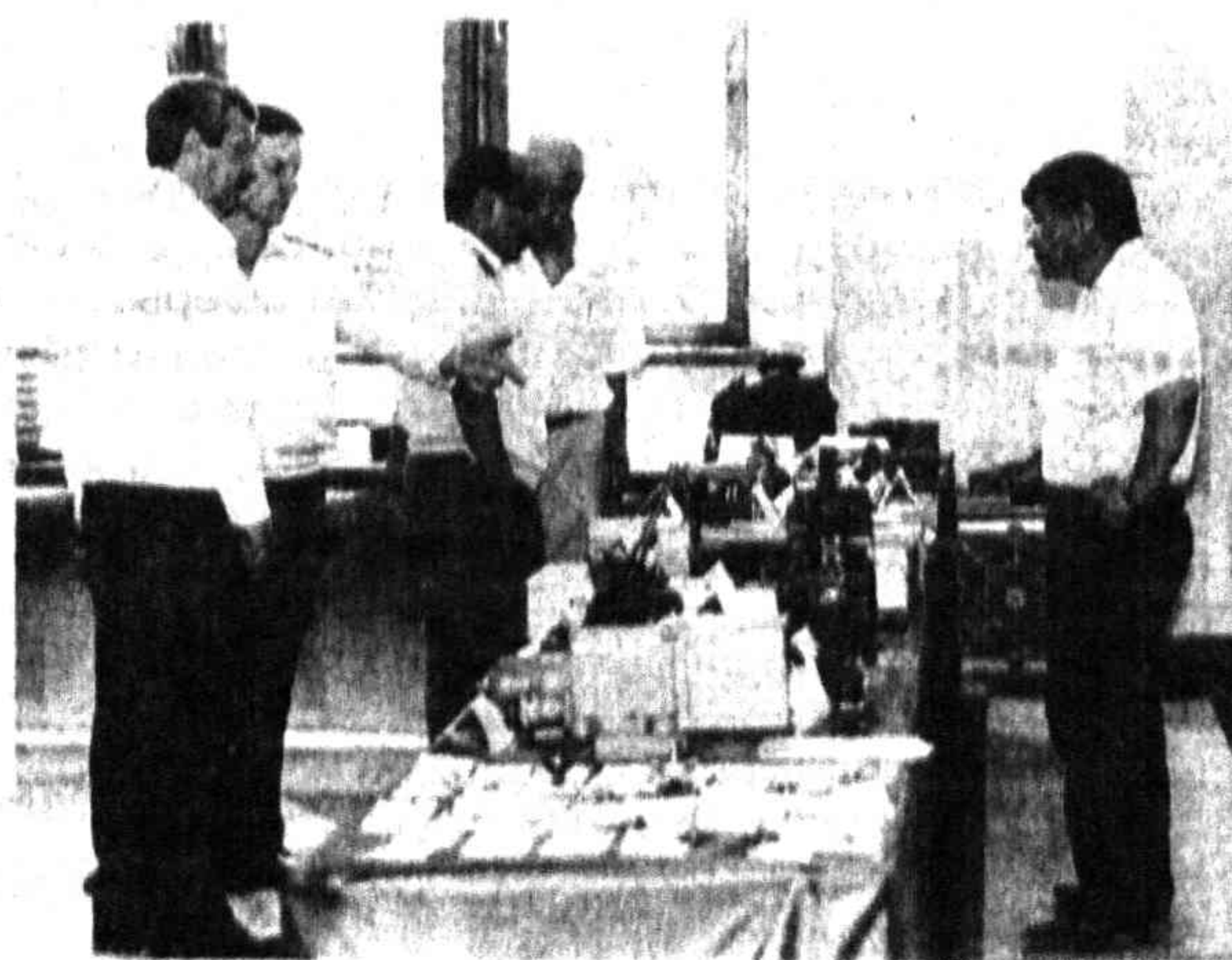
На снимке: у стендов выставки. Текст и фото А. САИТОВОЙ.

заказа — ангренское АО «Резинотехника». Оно уже налаживает выпуск диэлектрической обуви и перчаток для ремонтного персонала электрифицированных участков железной дороги.