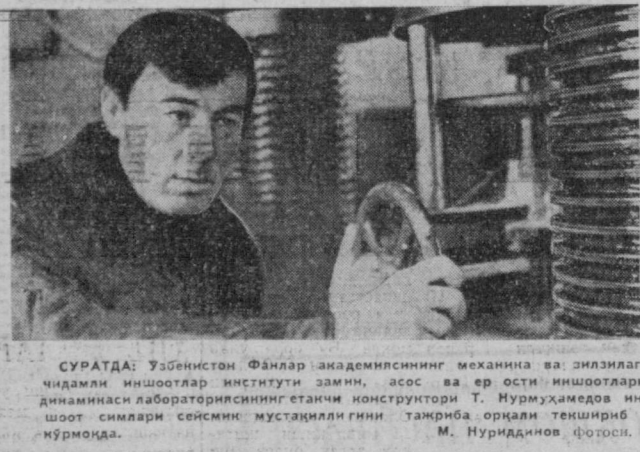
СУРАТДА: Узбекистон Фанлар академиясининг механика ва динизлага...

ТОШКЕНТ ШАҲРИДАГИ ҚУИДАГИ КИТОБ МАГАЗИНЛАРИГА КИТОБЛАРИНИНГНИ ТОПШИРИШГА ТАҚЛИФ ҚИЛАМИЗ: